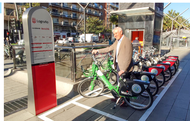
■ Gran Vía acoge dos de las nuevas estaciones virtuales.

marcha de la iniciativa 'Muévete por Logroño con una bici eléctrica', por la que Bicilog ofrecerá a las personas interesadas dos viajes de bicicleta eléctrica gratuitos por usuario, tanto para quienes ya están registrados como los nuevos que se registren.