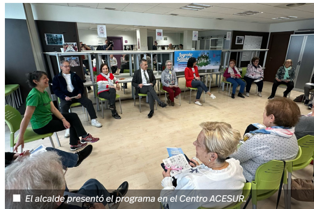
■ El alcalde presentó el programa en el Centro ACESUR.

El programa de actividades se puede consultar en logrosaludable.es .