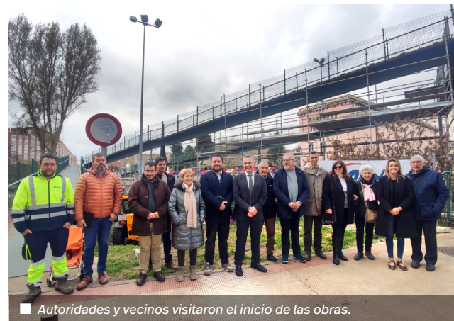
■ Autoridades y vecinos visitaron el inicio de las obras.

El alcalde visitó las obras el pasado miércoles y quiso “dejar patente el cumplimiento de un compromiso y una mejora en la accesibilidad entre barrios. Eso pasa por mejorar el tratamiento de la seguridad de acuerdo con ADIF para incrementar la altura del vallado, mejorar la solución antideslizante para permitir que tanto la pasarela como las escaleras sean más seguras a la hora de caminar, mejorar la estética y también la iluminación. Era una pasarela que necesitaba sí o sí este refuerzo”.