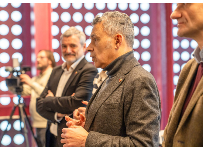
■ Momento de la presentación del proyecto en Logroño.

Este proyecto fomenta la cooperación estratégica entre los ayuntamientos y entidades clave como el Ministerio de Industria, Comercio y Turismo, NextGenerationEU y el Plan de Recuperación, Transformación y Resiliencia. Se creará, además, una plataforma digital integrada para gestionar las rutas turísticas, optimizar el marketing online y brindar una atención lo más personalizada.