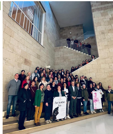
■ Encuentro con personas usuarias de los talleres municipales de apoyo psicosocial.

Además, en 2007 se puso en marcha 'Ser hombre hoy', un espacio de encuentro, reflexión y asesoramiento para el fomento de comportamientos acordes con la igualdad de género, dirigido a hombres mayores de 18 años. Y en 2021 se iniciaban unos talleres de autoestima para muchachas jóvenes a partir de 16 años.