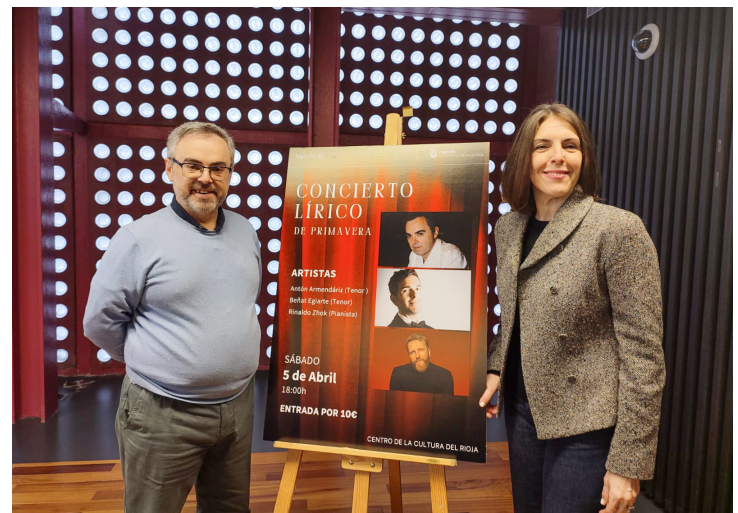
■ Cartel del concierto y momento de su presentación.

Las entradas cuestan 10 euros y se pueden comprar en la página web www.sacatuentrada.es