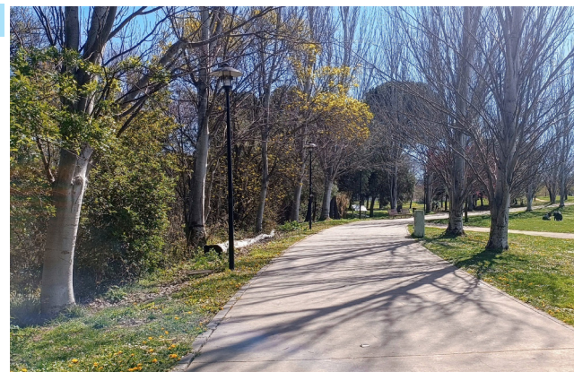
■ El mantenimiento de los espacios verdes se gestionará con criterios de circularidad.

El contrato debía haberse actualizado en 2018, pero desde marzo de ese año quedó estancado con sucesivas medidas cautelares. Una de las dos empresas de la UTE, Agua y Jardín es local, lo que refuerza el perfecto conocimiento de las infraestructuras a mantener, así como un mayor compromiso con la ciudad.