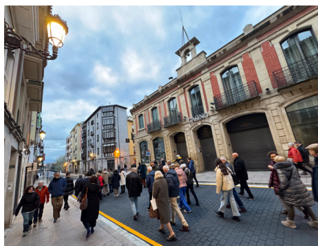
■ La inauguración de la calle contó con un recorrido guiado.

L a calle Sagasta ya muestra su nueva cara después de las obras de remodelación acometidas en los últimos meses. El alcalde de Logroño, Conrado Escobar, junto con varios miembros de la Corporación, inauguró el pasado jueves 27 de marzo la calle Sagasta tras estos trabajos de reforma. Una actuación que “supone una clara mejora para Logroño: una mejora para los logroñeses y logroñesas, para quienes nos visitan y para el sector comercial”.