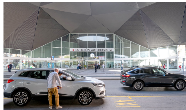
■ Entorno de las estaciones de autobuses y ferrocarril.

Además, se introducirán nuevos elementos tecnológicos inteligentes de señalización. Por un lado, los carriles exclusivos anteriores se delimitarán con captafaros LED encastrados. Por otro, tanto en la entrada como en la salida de autobuses a la estación, se va a instalar un doble sistema de sensores fotoeléctricos, que, ante la presencia de autobuses por un lado y de peatones por el otro, activarán señales luminosas de aviso al otro usuario.