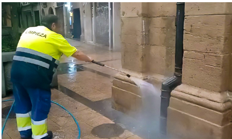
■ Limpieza exhaustiva a presión en Portales.

También novedoso ha sido el tratamiento de limpieza exhaustiva a presión que se ha hecho en los pilares de los soportales de la calle Portales para eliminar tanto las manchas producidas por actos incívicos y orines de animales, como las humedades pa-