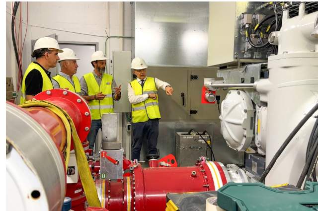
■ El alcalde visitó las nuevas instalaciones soterradas.

La actuación va a suponer la transformación de la ciudad en este entorno que, con las obras de la integración de la subesta-