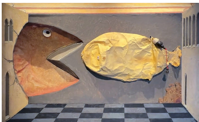
■ La exposición recoge trabajos de prestigiosos autores riojanos, nacionales e internacionales.