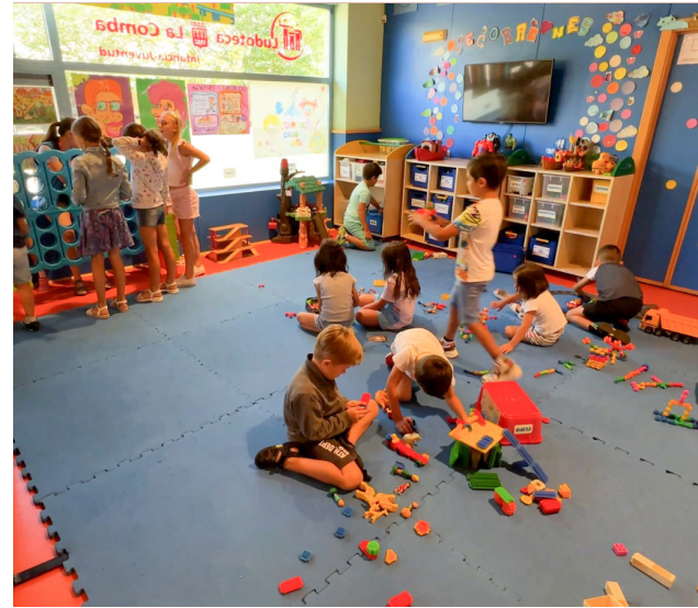
El Ayuntamiento de Logroño cuenta con una oferta de nueve ludotecas y un centro infanto-juvenil.

Además, el Ayuntamiento cuenta con el programa de 'Ludoteca abierta', por el que se ofrecen 750 plazas cada sábado. De ellas 645 serán en horario de mañana (en tres turnos de una hora cada uno, entre las 10:30 y las 13:30 horas) en las ludotecas Cucaña, El Trevecito, La Peonza y La Comba; y 105 plazas en horario de tarde (también en tres turnos, de 17:00 a 20:00 horas) en la ludoteca El Trevecito, la única que también abre en horario vespertino. También en el caso del programa de 'Ludoteca abierta' se han aumentado en 135 las plazas respecto al curso anterior.