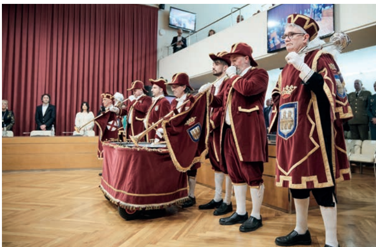
■ La sesión solemne se inició con la llamada a Concejo con clarines y timbales.