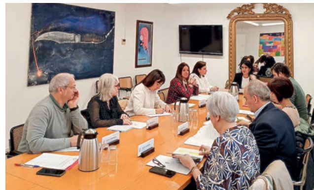
■ Reunión de la Mesa contra la Pobreza.

A fecha de hoy, los centros municipales han ofrecido alojamiento 174 días, frente a los 130 días en campañas anteriores, prestando así durante más tiempo el servicio y permitiendo también atender a personas a lo largo del mes de abril, cuestión que antes no se producía. De un total de 77 plazas municipales, no se han cubierto