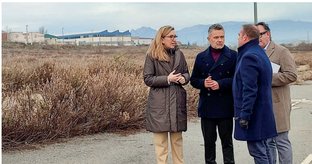
■ El polígono de Las Cañas verá mejorada su infraestructura eléctrica.

La reposición de la línea eléctrica del polígono de las Cañas será la inversión más destacada de una serie de 46 que se financiarán con un préstamo de 9 millones de euros aprobado recientemente por la Junta de Gobierno. A ella se destinarán 1,5 millones, que serán parte de una actuación más amplia cofinanciada por el Gobierno de la Rioja para el impulso de un programa de suelo industrial en Logroño.