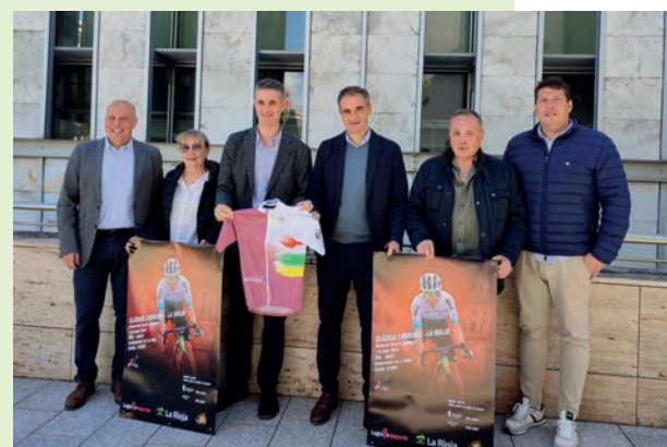
Organizadores y representantes del Ayuntamiento y Gobierno de La Rioja presentaron la prueba.

Desde la desaparición de la Vuelta Ciclista a La Rioja, Logroño carecía de una prueba ciclista profesional de este tipo. Por ello, la prueba cuenta con el apoyo y el respaldo decidido de Logroño Deporte. El evento tiene salida y meta en Logroño, en la plaza del Ayuntamiento y recorrerá otros 18 municipios riojanos; la salida se producirá a las 12 horas.