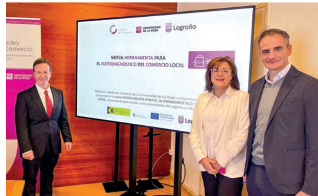
■ Presentación de la nueva herramienta de autodiagnóstico del comercio.

El acceso a la aplicación es gratuito y se puede realizar, de forma sencilla, a través del enlace evaltienda.unirioja.es tras cumplimentar un breve formulario de registro. Información o dudas, en catadra.comercio@unirioja.es y el teléfono 941 299 381.