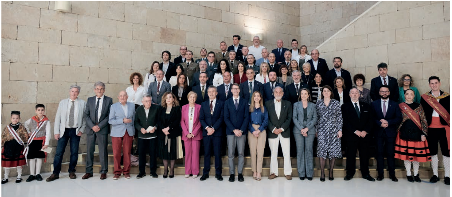
■ La Corporación, acompañada por las autoridades invitadas, ex-alcaldes y otros protagonistas del acto, al final del Pleno.