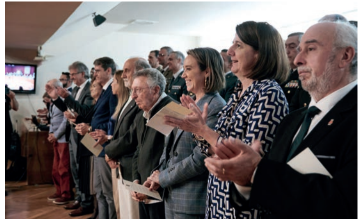
■ Presidentes de la Comunidad y del Parlamento, Delegada del Gobierno y ex-alcaldes.