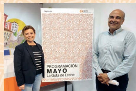
■ Presentación de la programación de mayo.