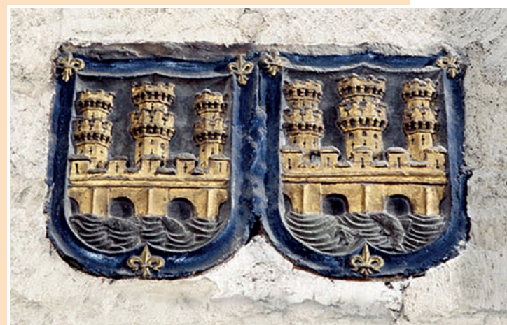
■ Escudo de la ciudad, doble, que se encuentra en el archivo de Santiago.

Desde su fallecimiento, Logroño ha carecido de cronista oficial. Hasta ahora, veintidós años después.