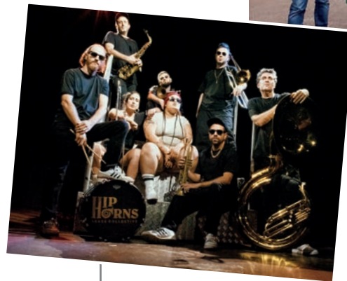
■ Hip Horns Brass Collective.

Además, durante el fin de semana, es ' Logrorleans '.