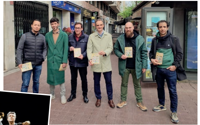
■ Organizadores y colaboradores presentaron el programa de actuaciones de calle.

• A la 1 de la tarde , actúa ' Conjunto Saoco ' en la antigua estación de autobuses.