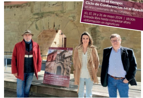
Presentación del ciclo de conferencias junto a la muralla del Revellín.