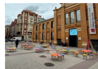
■ Arriba, el balance de Concéntrico se hizo junto a la instalación Popplar assembly. Abajo, las otras dos propuestas que se mantendrán.