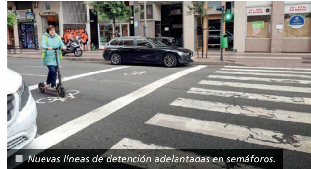
■ Nuevas líneas de detención adelantadas en semáforos.

La Junta de Gobierno también aprobó en su sesión del pasado miércoles la instalación de señales luminosas en los pasos ciclistas de las calles General Urrutia con Comandancia, en Clavijo, a la altura del Palacio de los Deportes, Fuente Murrieta con Martínez Laorden y Fuente Murrieta con Marqués de Murrieta.