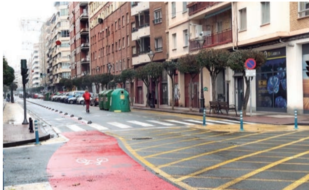
■ Duquesa de la Victoria se adecuará en la segunda mitad del año.

E l proyecto de adecuación de la calle Duquesa de la Victoria para consolidar el eje ciclista devolverá al carril de circulación de vehículos la continuidad lineal en de toda la vía, evitando trazados sinuosos. La consolidación de un eje ciclista segregado, bidireccional hasta Juan XXIII, será su otra gran seña de identidad. Y más aparcamientos en uno o en ambos lados de la calle según tramos.