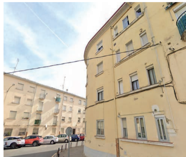
Las ayudas se dirigen a entornos urbanos delimitados.

Para establecer la prioridad en la concesión de estas ayudas, “se tendrá en cuenta el estado de la edificación y su situación en el tejido urbano del conjunto de la ciudad, potenciando aquellas que por su ubicación