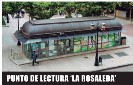
PUNTO DE LECTURA 'LA ROSALEDA'

● 7 de marzo, 17:30 h. Artefábrica 'Cápsula Día de la Mujer' . / 17:00 horas. 'Jugones' realizada por Asprodema. / 18:00 h. Club de lectura de inglés. Edades de 8 a 10 años.