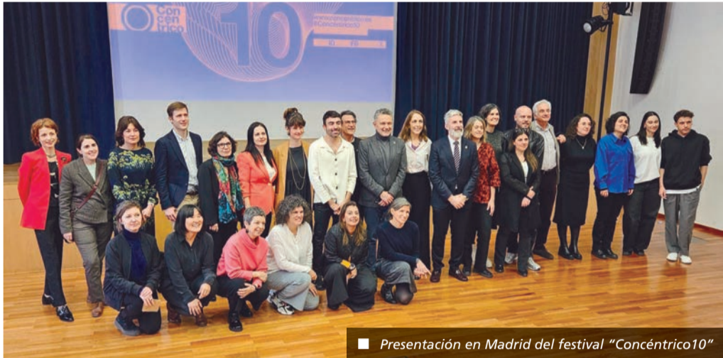
■ Presentación en Madrid del festival "Concéntrico10"

Así, el proyecto ganador de la convocatoria 'La calle a diez años', realizado para imaginar un espacio urbano en los próximos diez años en el entorno de La Glorieta, se va a incorporar al proyecto de remodelación que va a acometer el Ayuntamiento en esta céntrica plaza. En este caso, el proyecto