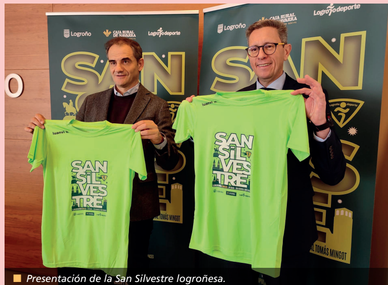
Presentación de la San Silvestre logroñesa.

19:00 a 20:30 h. Pista de Hielo (de 11 a 18 años). Con cuota. POLIDEPORTIVO MUNICIPAL DE LOBETE. Inscripción: hasta el 22 de diciembre. Sujeto a disponibilidad de los espacios.