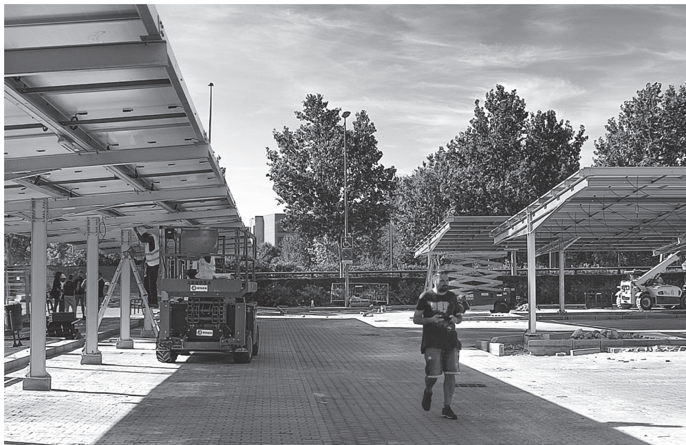
■ Instalación fotovoltaica en el parking de la plaza de la Vendimia.

La actuación ha supuesto una inversión de 1,23 millones de euros, de los cuales 341.351 euros serán financiados por el