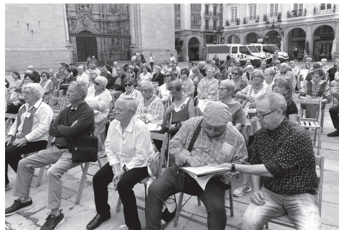
■ Jornada celebrada en el marco del Día Internacional de las Personas Mayores