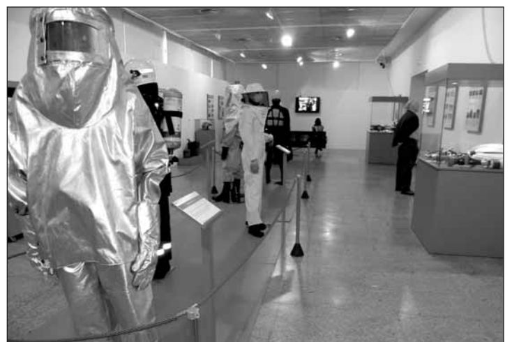
Los trajes de intervención son una de las zonas más visitadas.