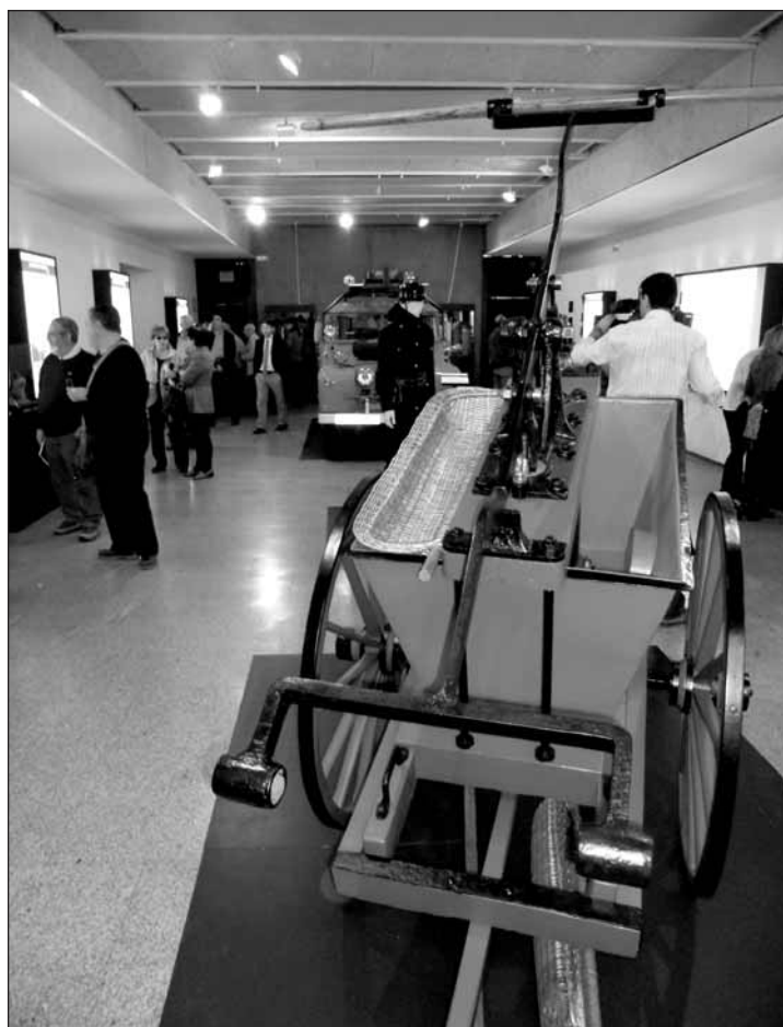
En primer plano, una bomba manual que se utilizaba hace décadas.