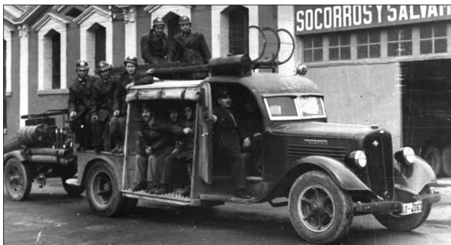
Arriba, Bomberos de Logroño en 1948. Abajo, una de las salas de la Casa de las Ciencias que está ocupada por esta exposición.