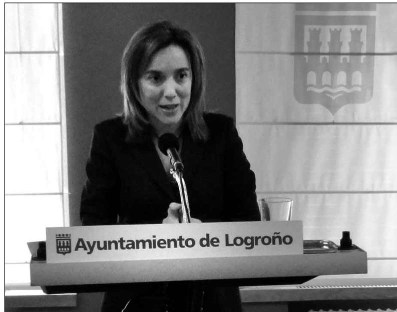
Gamarra anunció las medidas que implantará el Ayuntamiento para beneficiar a las pymes

Asimismo, y para las llamadas "licencias comunicadas", que en estos momentos representan alrededor de un 45 por ciento del total, se adelanta su entrada en vigor de