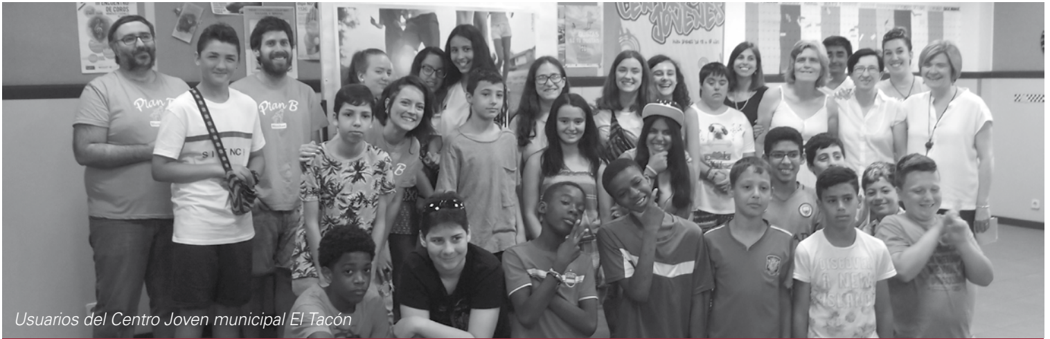
Usuarios del Centro Joven municipal El Tacón