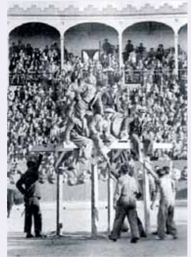
Tradicional Cuba de las Vaquillas de San Bernabé (1951).

No han faltado incidencias y excepciones: en 1583 los menestresiles (músicos) pretenden abandonar la ciudad porque no se les paga salario; en 1601 se revitaliza la fiesta tras la peste de 1599 con la realización de torneos; en el siglo XVII se quiere suprimir por la falta de presupuesto (la fiesta de San Bernabé se llevaba en 1682 el 58% de los gastos municipales de festejos); en 1862 se impulsa la fiesta para recuperar el banderazo 'perdido'; en 1865, treinta y cinco jóvenes piden que las andas del santo las porten 8 personas naturales o vecinas de Logroño, por turno, y no forasteros y gentes de paso. En 1931, la procesión es suprimida quedando únicamente la función cívica. Incidencias aparte, la fiesta, en lo institucional y lo popular, en lo cívico y en lo religioso, tiene casi quinientos años de vida.