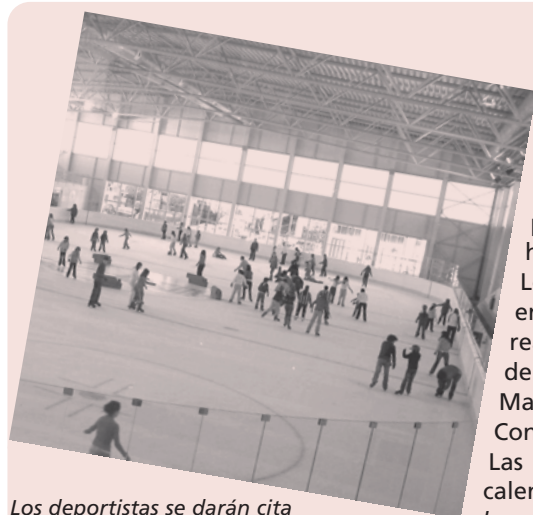
Los deportistas se darán cita mañana en la pista de hielo de Lobete.

Las personas que estén interesadas pueden posar para un calendario que estará dedicado a 'Logroño 2010, capital de las personas'.