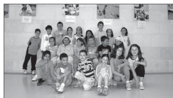
Uno de los proyectos recientes de Ayuda en Acción ha sido la reconstrucción de una escuela en Perú.

les sirve para mantener una relación con niños de otros países y con sus comunidades a través de un vínculo solidario, que les acerca a su realidad personal de una forma directa y cercana. Gracias a estos 'embajadores riojanos' se propicia la interculturalidad desde el conocimiento y el respeto mutuo, fortaleciendo la solidaridad y la promoción de los derechos humanos.