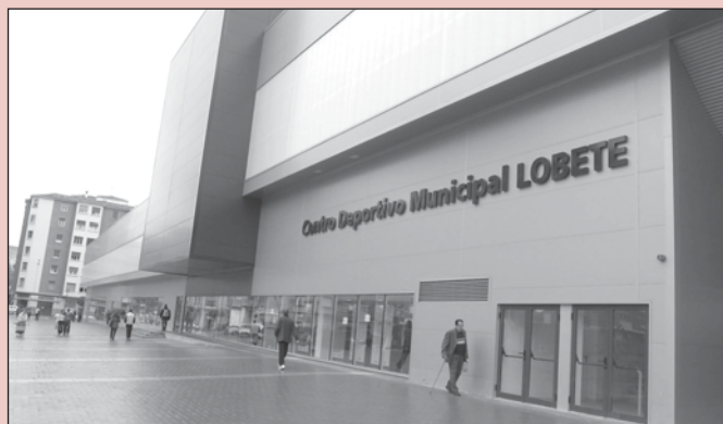
El centro de Lobete albergará algunos de los juegos deportivos.