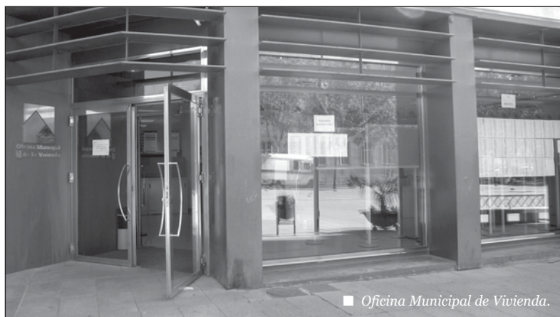
■ Oficina Municipal de Vivienda.