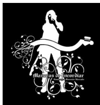
■ Carátula del nuevo disco.

El disco 'Maneras de Incordiar', cuya grabación ha sido auspiciada por La Gota de Leche, contiene algunos de los temas más célebres de Rosendo, aunque interpretados desde la personalísima visión de los grupos de rock riojanos que han participado en el proyecto.