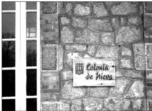
■ La colonia de Nieva en Cameros, recientemente remodelada.

La Colonia de Nieva en Cameros, gestionado por el Área de Juventud del Ayuntamiento de Logroño, se convierte este fin de semana en la sede de un Campamento Multiaventura dirigido a niños y niñas de entre 8 y 11 años. Además de acoger actividades previamente organizadas desde el Ayuntamiento, estas instalaciones municipales están abiertas a su utilización por parte de asociaciones juveniles, instituciones y colectivos que lo soliciten con antelación.