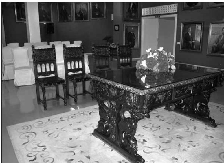
El lugar habilitado para esta función es el salón de retratos de alcaldes del Ayuntamiento, que es decorado de modo especial para celebrar los enlaces.

Las normas aprobadas por el Ayuntamiento para regular la tramitación de las bodas civiles establecen que éstas podrán officiarse únicamente en el edificio consistorial.