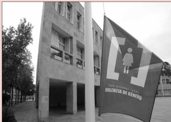
■ Esta bandera recordará el trágico balance de la violencia de género.

Por otra parte, la Mesa de la Mujer continuará celebrando concentraciones de repulsa contra la violencia de género el primer jueves de cada mes en la plaza del Ayuntamiento.