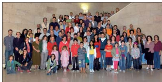
Foto de familia de los Voluntarios de Logroño.