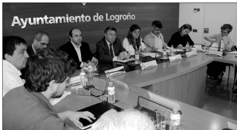
■ Mesa presidencial del Consejo Social celebrado el pasado martes.

Entre los países de origen de la población extranjera destaca Rumanía, ya que 5.626 vecinos de Logroño han nacido en este país europeo. Los rumanos y rumanas suponen un 27 por ciento del total de extranjeros empadronados en la ciudad. Otros países con gran presencia entre la población urbana son Pakistán, Bolivia, Marruecos, Colombia y Ecuador. El perfil medio del inmigrante es el de un varón joven que trabaja por cuenta ajena, con formación y renta baja.