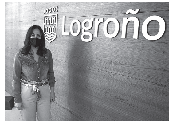
■ La concejala, en la presentación del nuevo contrato de suministro eléctrico.

Con esta medida, el Consistorio evita la emisión de 9.600 toneladas de dióxido de carbono, cantidad equivalente a las emisiones medias del consumo eléctrico de 6.700 hogares. También ayuda a mitigar el cambio climático y da un paso adelante en el cumplimiento del Pacto de Alcaldes, iniciativa de la Comisión Europea que aboga por mejorar la eficiencia y apostar por las fuentes renovables. También supone un nuevo avance en el camino hacia la Capitalidad Verde Europea.