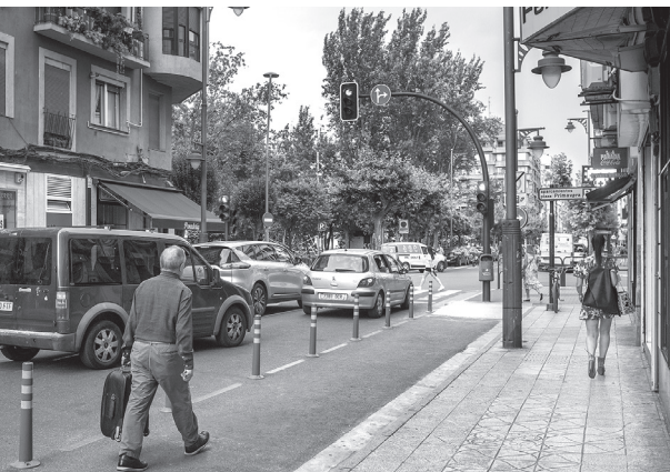
■ Aspecto actual de Avenida República Argentina en el tramo afectado.