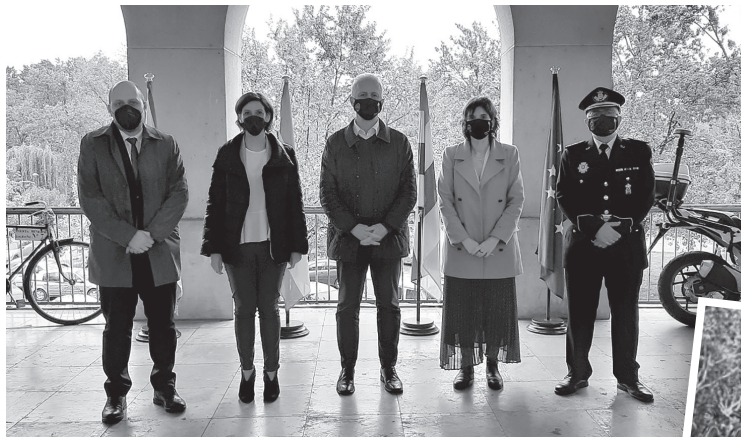
■ El alcalde, acompañado por las autoridades, presidió el acto de reconocimiento a la Policía Local.

L a Policía Local de Logroño cumplió, el 27 de abril, 160 años al servicio de la ciudadanía. El alcalde de Logroño, Pablo Hermoso de Mendoza, presidió en la comisaría de Rúavieja el acto de reconocimiento a una institución implantada en 1861. También asistieron la delegada de Gobierno, el director general de Justicia e Interior del Gobierno regional, además de una representación de las distintas unidades del cuerpo, encabezadas por su comisario jefe.