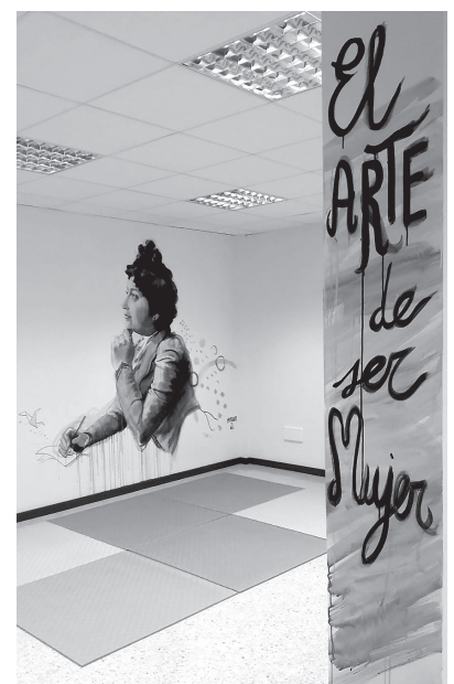
■ Interior del Laboratorio Feminista, donde se desarrollarán las sesiones grupales.

A partir de este diagnóstico, se determinarán los ejes y las medidas que debe recoger el 'II Plan de Igualdad de Logroño 2022-2025', en el que también participarán otras personas y grupos de interés de la ciudad, como organizaciones del tercer sector, del ámbito de la educación, asociaciones empresariales y vecinales, asociaciones feministas, medios de comunicación y grupos políticos, entre otros. Además, se ha presentado el informe de evaluación del 'I Plan de Igualdad 2012-2016', que ha alertado sobre el "poco o nulo trabajo realizado en su implementación, sobre su desconocimiento y sobre la percepción de que fue una iniciativa fallida", ha señalado la concejala de Igualdad, Eva Tobías Olarte, lo que se tendrá en cuenta para la elaboración del nuevo Plan.