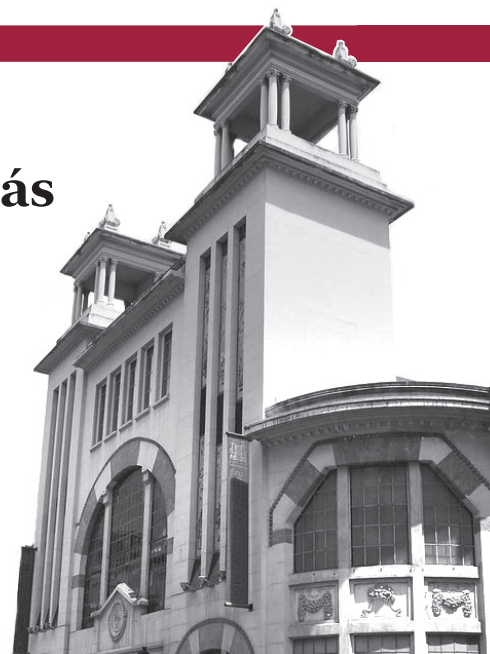
■ Fachada principal del Mercado de San Blas.

en mayo y ha sido “dialogado y consensuado con los comerciantes de la Plaza de Abastos, quienes desde que comenzó nuestro mandato nos transmitieron que el modelo del mercado no debía pasar por un cierre temporal de al menos dos años y una reubicación, como se planteaba en anteriores legislaturas”, destacó el alcalde, quien valoró que “tras muchos años de dudas e incertidumbre, esta nueva licitación ofrece un marco de seguridad en el que podrán trabajar a medio y largo plazo y colaborar en la mejora y actualización de un mercado que es santo y seña de nuestra ciudad”.