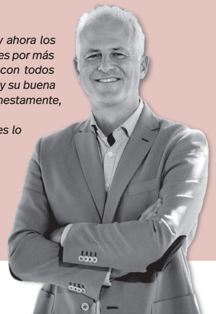
Pablo Hermoso de Mendoza / Alcalde de Logroño

Sigamos. Cumpliendo y trabajando. Sus gentes lo merecen. Logroño es un reto apasionante.