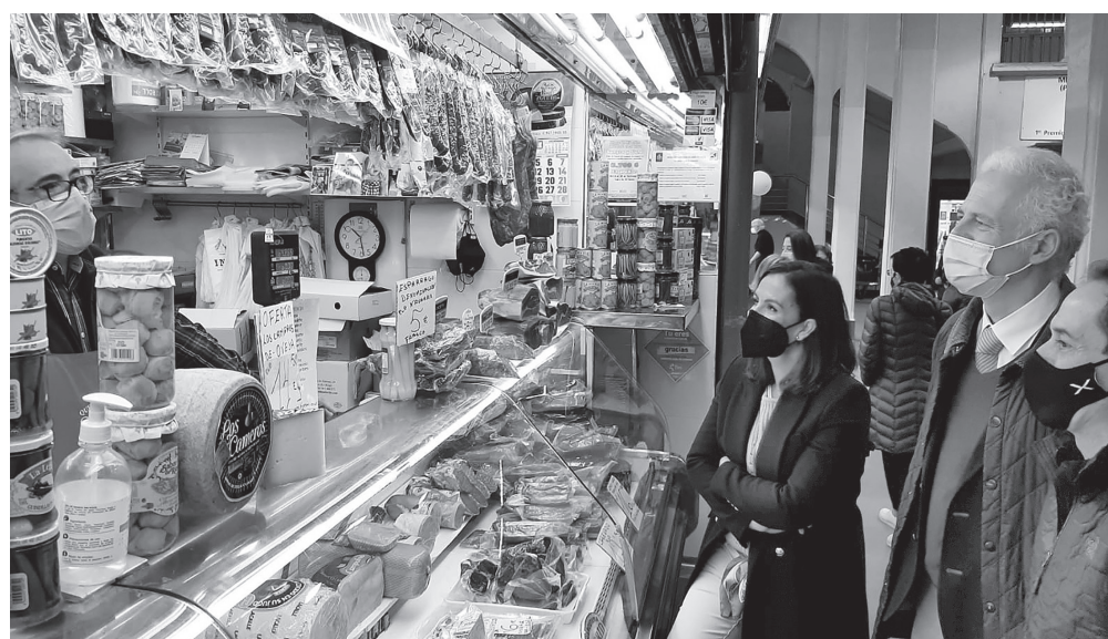
■ El alcalde y la concejala de Economía visitan a los comerciantes del Mercado de San Blas.

La resolución de este proceso ofrece cobertura jurídica a los comerciantes del Mercado, donde se llevarán a cabo varias reformas que no supondrán el cese temporal de la actividad económica, como la adecuación de los sistemas eléctricos o la modernización de los sistemas de refrigeración, entre otras actuaciones.