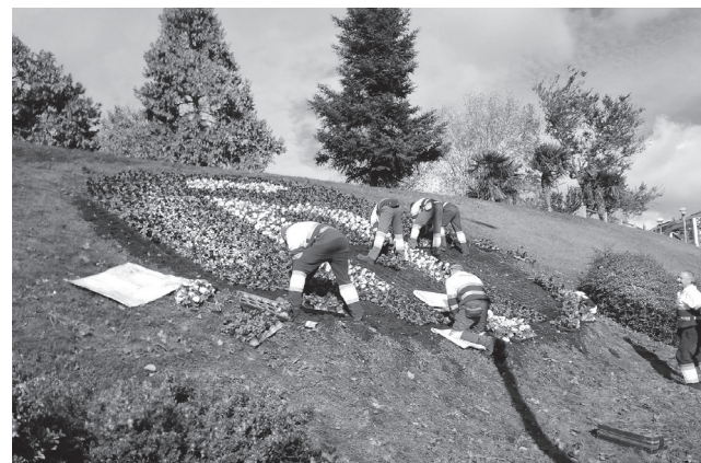
■ Labores de plantación de flores en la 'ñ' del parque San Miguel.

La previsión de plantación en esta campaña de invierno comprende catorce especies de flor, que suman en total 50 930 plantas. Se trata de pensamiento mezcla (12 000), viola mezcla (7 000), tulipán (7 000), caléndula (5 000), primula mezcla (4 000), clavel mezcla (3 000), pacarete habanero (3 000), go-