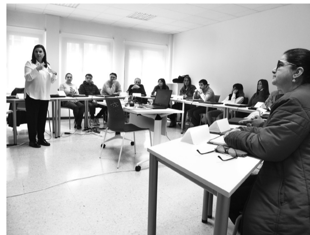
■ Los colectivos de la ciudad pueden optar a estas ayudas.

Estas subvenciones tienen por objeto apoyar económicamente las actuaciones que en estas materias lleven a cabo entidades sin ánimo de lucro de nuestra ciudad y que son complementarias de los programas y proyectos municipales. Entre ellas se priorizarán los proyectos que desarrollen acciones dirigidas a los mayores, mujeres, personas con discapacidad y colectivos sociales con especiales dificultades de inserción social. Además, fomentan los proyectos que favorecen la convivencia intercultural.