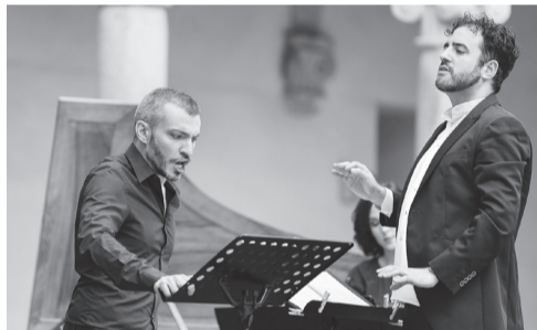
Nereydas. Filippo Mineccia.

Los conciertos de la Sala de Cámara de Riojafórum de esta edición, que se celebrarán del 1 al 4 de septiembre, cuentan con destacados músicos e intérpretes de reconocida solvencia internacional. Nereydas abrirá el programa, el martes 1 de septiembre , con un deslumbrante 'Siface: L'amor castrato', interpretado por el contratenor Filippo Mineccia.