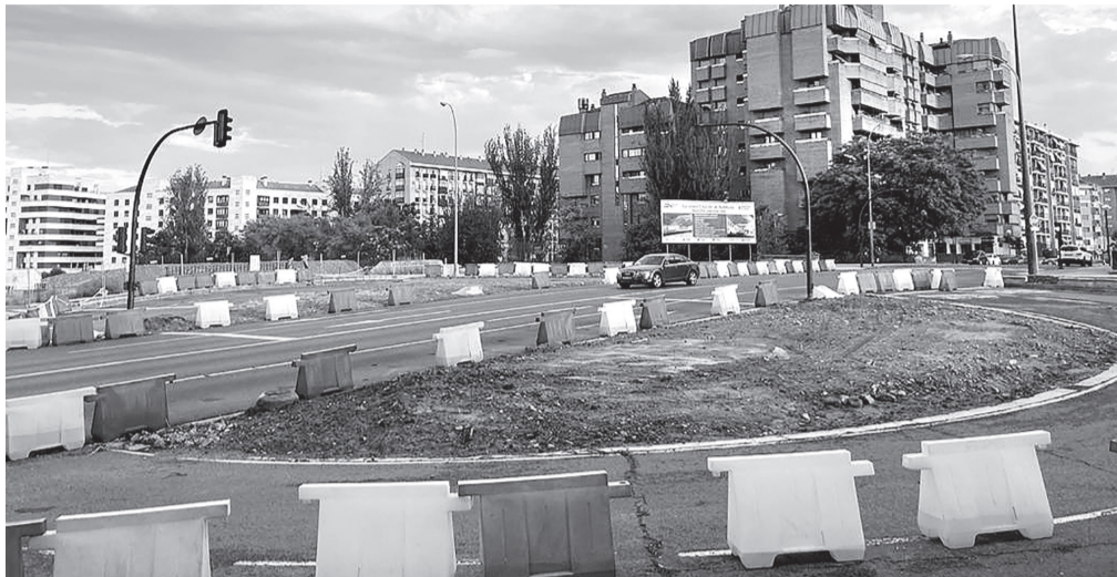
■ Imagen actual del nudo de Vara de Rey tras las actuaciones de limpieza realizadas recientemente.

Al mismo tiempo, ha sido ratificada con el Consejo de Administración de LIF la resolución del convenio que mantenía con el Ayuntamiento de Logroño para la ejecución de la alternativa C que proponía la construcción de un túnel. Este cambio de opción supone