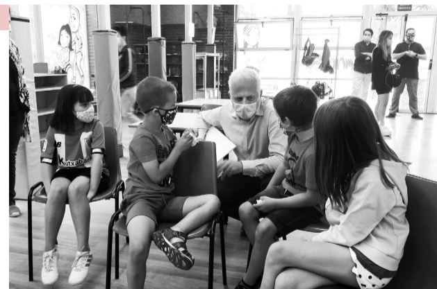
■ El alcalde de Logroño visitó la ludoteca Cucaña.

Este verano las ludotecas ofrecen 1.200 plazas para niños y niñas de entre 6 y 12 años. Además, se han abierto las puertas de los centros jóvenes a los adolescentes de