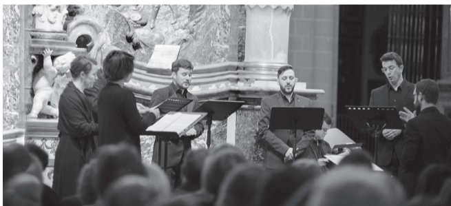
La Grande Chapelle.

El miércoles 2 de septiembre , será el turno del conjunto vocal e instrumental La Grande Chapelle , que ofrecerá una selección exclusiva de canciones y madrigales.