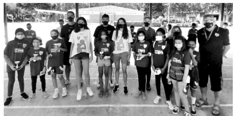
■ El concejal de Deportes junto con los participantes.

nuestra ciudad. La base de su estancia se establece en el CEIP Madre de Dios y disponen de otros polideportivos y centros de Logroño Deporte para el desarrollo de sus actividades. En este sentido cobra valor la extensa red de instalaciones deportivas con que cuenta el Ayuntamiento que permite programar actividades físicas con todas las garantías.