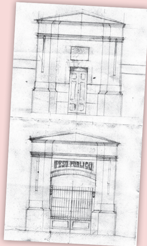
■ Croquis para construir el Peso, 1875

Las unidades de medidas tradicionales fueron sustituidas por el Sistema Métrico Decimal en 1868 con el Reglamento