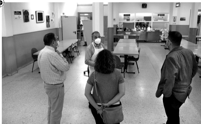
■ Cocina Económica repartió más de 82.000 raciones el año pasado.

El Ayuntamiento de Logroño ha firmado un contrato con Cocina Económica para la prestación del servicio de comedor social hasta junio de 2022, por un importe total de 800.000 euros.