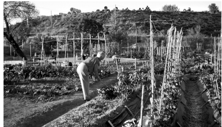
■ El Ayuntamiento dispone de 258 huertos de ocio.

En estos huertos se promueve el cultivo de agricultura ecológica,