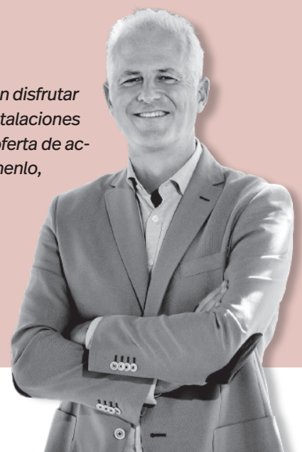
Pablo Hermoso de Mendoza | Alcalde de Logroño

sonas que descansan en la ciudad y la quieren disfrutar de otra manera. También las excelentes instalaciones deportivas municipales ofrecen una amplia oferta de actividades para todos los públicos. Aprovechenlo, les deseo un feliz verano.