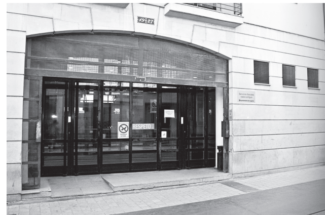
■ Centro de Servicios Sociales Casco Antiguo, uno de los nueve que atienden a familias.

Por ello, ha añadido, “la Junta de Gobierno Local ha aprobado el expediente de contratación técnica de los servicios complementarios de intervención familiar que nos va a permitir ampliar los recursos humanos, pasando de cinco a seis trabajadores sociales y de uno a dos integradores sociales, así podremos atender a más familias con mayor intensidad y dedicación”.