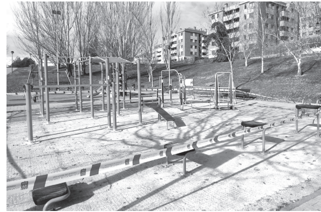
■ Área de calistenia en el parque de El Arco.

De esta manera, se ofrecerán nuevos espacios a la juventud y también a la ciudadanía que se ejercita corriendo, en bici o paseando en los parques. En la actualidad, en Logroño existen áreas de calistenia en la plaza México, el parque de La Ribera (workout) y en El