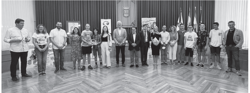
■ Integrantes del Consejo de Infancia reciben el premio ante miembros de la Corporación municipal.