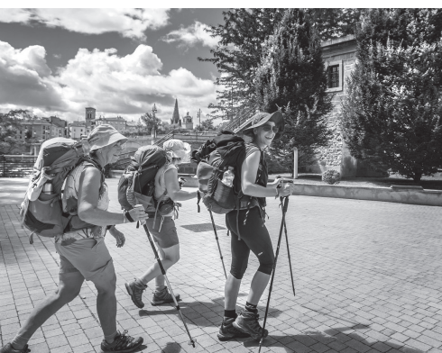
■ Tres peregrinas del Camino de Santiago llegan a Logroño.

Unos 7 000 peregrinos y peregrinas del Camino de Santiago han visitado Logroño durante el primer semestre, según datos de la Concejalía de Turismo. Hasta junio, 4 570 se hospedaron en el albergue municipal y 6 373 sellaron su credencial en el punto de información del Puente de Piedra.