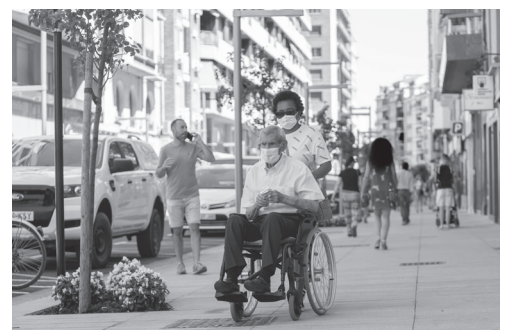
■ La calle República Argentina ha ganado espacio peatonal, ha incrementado el arbolado y ha incorporado estacionamiento para motos y bicicletas.