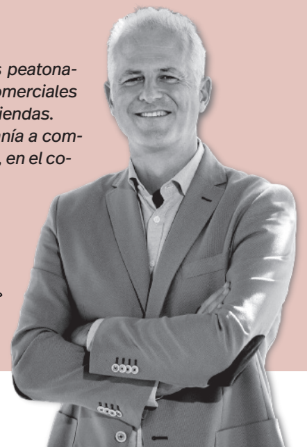
Pablo Hermoso de Mendoza / Alcalde de Logroño

Acabamos de presentar los próximos pasos peatonales, alguno de ellos situado en las zonas comerciales para mejorar y facilitar el acceso a nuestras tiendas. Aprovecho también para animar a la ciudadanía a comprar siempre, especialmente en estas fechas, en el comercio de Logroño.