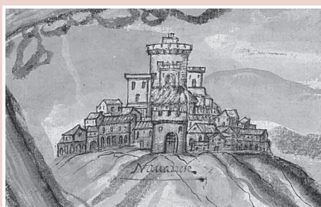
■ Castillo de Navarrete.