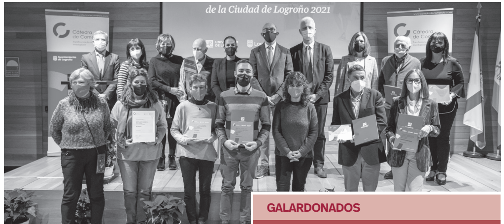
■ Autoridades y galardonados en los 'Premios Comercio Excelente de Logroño 2021'.

Este año ha habido dos nuevas categorías: el 'Premio Digitalización', destinado a reconocer iniciativas que hayan contribuido a