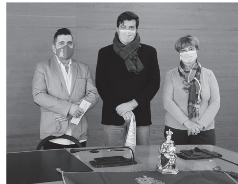
■ El concejal de Participación Ciudadana y miembros de la Cofradía de la Virgen de la Esperanza, en la presentación de las actividades.

El sábado, día 18, a las 11:00 horas, se inaugurará el belén monumental del Ayuntamiento, que abrirá sus puertas hasta el 7 de enero. A las 11:40 horas habrá una nueva 'Llamada a Concejo', procesión hasta Santiago, donde se celebrará misa solemne. Tras ésta, el alcalde ofrecerá a la Cofradía Virgen de la Esperanza un pergamino del V Centenario. A las 19:30 horas, el Auditorio acogerá el 'Festival Folclórico Virgen de la Esperanza', con música y danzas del Grupo Aires de La Rioja y a las 21:00 horas, en La Redonda, tendrá lugar el concierto 'Día de la Esperanza', con música barroca a cargo del