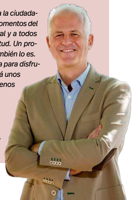
Pablo Hermoso de Mendoza | Alcalde de Logroño