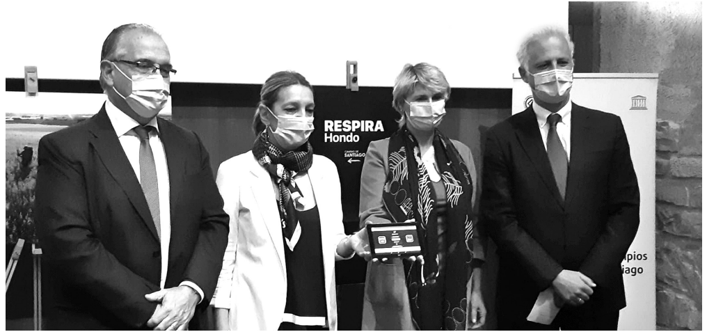
■ Presentación en Pamplona de la aplicación dirigida a los peregrinos y peregrinas.

Este proyecto, pensado inicialmente para el próximo Año Santo 2021, se pone ya en marcha en un contexto en el que resulta prioritario que los peregrinos y peregrinas cuenten con toda la información necesaria para realizar su viaje con seguridad en la actual situación de pandemia. El sistema funciona mediante dispositivos sencillos instalados en los albergues y su uso es muy simple. Serán los propios hospitaleros quienes irán restando plazas según vayan haciendo el registro los peregrinos. Los da-