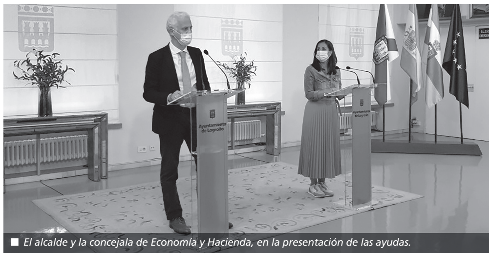
■ El alcalde y la concejala de Economía y Hacienda, en la presentación de las ayudas.

Asimismo, inició un proceso para la contratación pública de 19 obras en la ciudad con el fin de activar sectores económicos como la construcción y afines a través de la ejecución de las inversiones previstas en el presupuesto 2020.