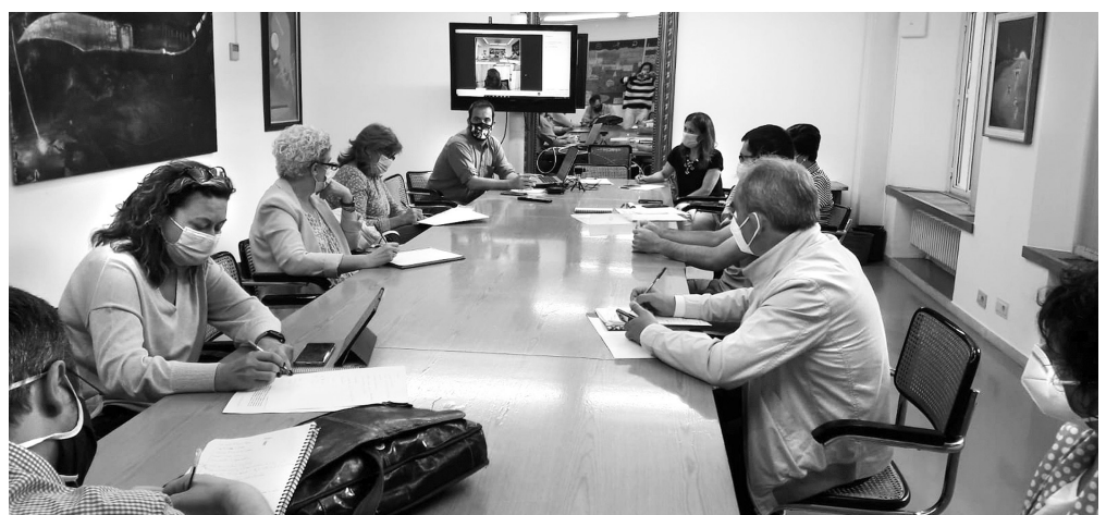
■ Reunión de la Mesa de la Pobreza el pasado martes.

Su funcionamiento se regirá conforme a los protocolos establecidos de uso de mas-