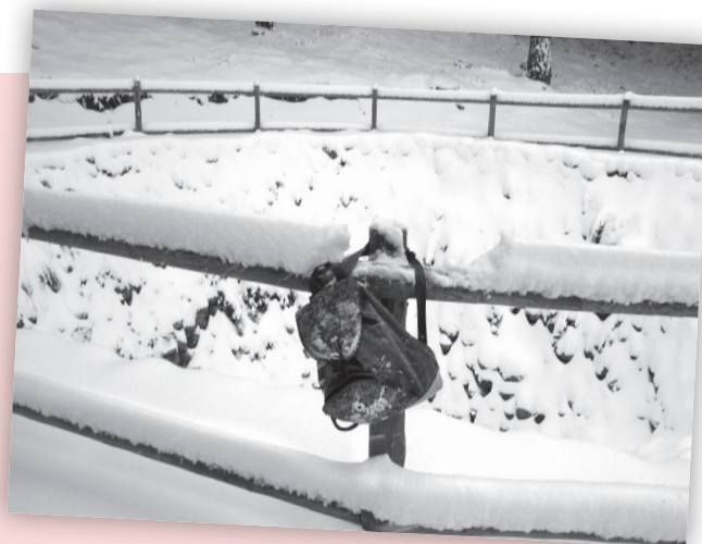
■ Nevera de Logroño en Moncalvillo

Los concejos consideraron la venta de la nieve como un monopolio municipal y un servicio público, al ser producto de primera necesidad. En Logroño optaron por arrendar dicho derecho a un particular; por ejemplo, en 1751 los derechos los