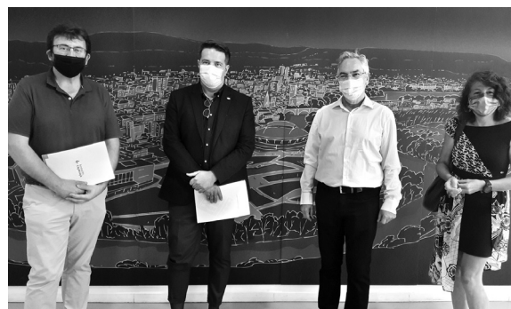
■ Presentación del programa del curso 2020-2021 de la UPL.

Es una organización que defiende el derecho a la educación y a la formación durante toda la vida. También se llama UPL.