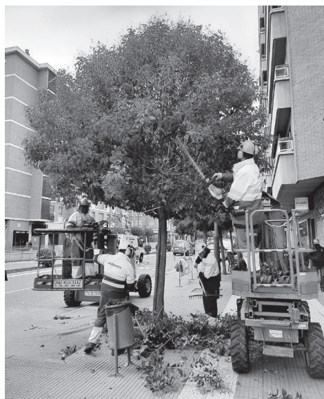
Personal de la empresa de mantenimiento realiza los trabajos de poda.

El Ayuntamiento de Logroño ha comenzado la campaña de podas del arbolado de la ciudad. Se pretende consolidar los criterios seguidos el año pasado, que son acordes con el programa Escudo Verde, por lo que se aboga por una poda más natural, alejada de desmoches y formas artificiosas en cubo o en bola.