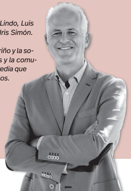
Pablo Hermoso de Mendoza | Alcalde de Logroño

No quiero terminar esta carta sin mostrar el cariño y la solidaridad de Logroño con la familia, los amigos y la comunidad educativa del colegio Jesuitas por la tragedia que están viviendo. Toda la ciudadanía está con ellos.