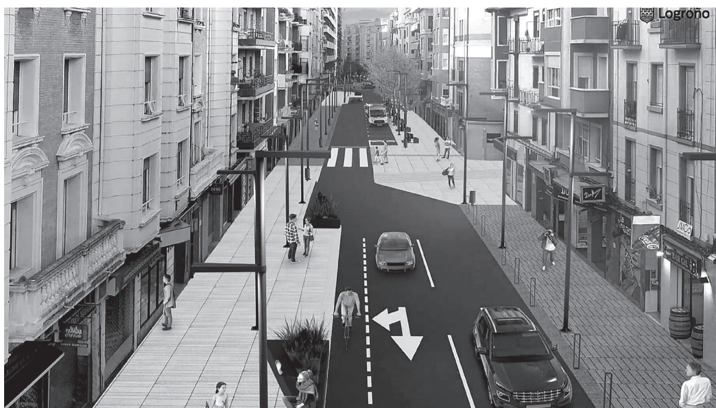
■ El único carril que tendrá la calle desde su acceso en Gran Vía se amplía a dos en el tramo cercano a Pérez Galdós, para facilitar el tráfico en el cruce.

Con esta intervención se consolidan las medidas adoptadas con motivo de la pandemia de la COVID-19 que se pusieron en marcha en mayo de 2020 con el objetivo de ampliar el espacio público destinado a los peatones.