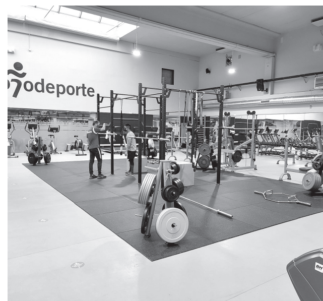
Nueva sala de musculación en La Ribera.

El Centro Deportivo Municipal La Ribera fue inaugurado en 2007. Cuenta con un campo de fútbol de hierba artificial con graderío; una piscina cubierta de 25x18 metros y otra para enseñanza de 18x10 metros, además de un jacuzzi y dos saunas. El centro también cuenta con un espacio social, en el que hay una ludoteca, una biblioteca y otras salas polivalentes, algunas de ellas gestionadas por la Asociación de Vecinos de San José y por el Club Deportivo Villegas.