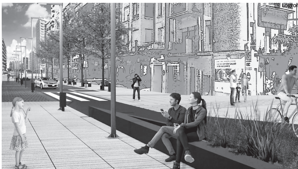
■ Se crea un nuevo paso peatonal en la intersección con Pilar Salarrullana y la calle gana en espacios estanciales y aceras más amplias.