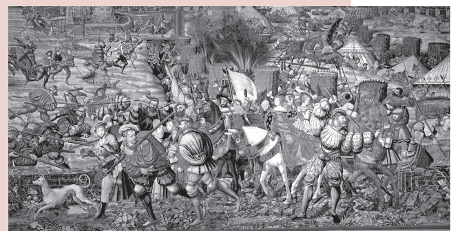
■ Batalla de Pavía. Bernard Van Orley. Museo de Capodimonte.

Está preparando una gran ofensiva contra