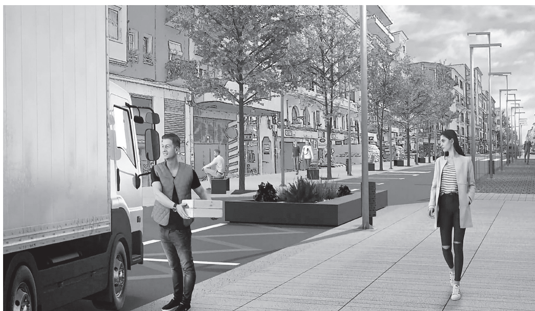
■ La calle mantiene aparcamientos de alta rotación y de carga y descarga para facilitar la logística del uso comercial.