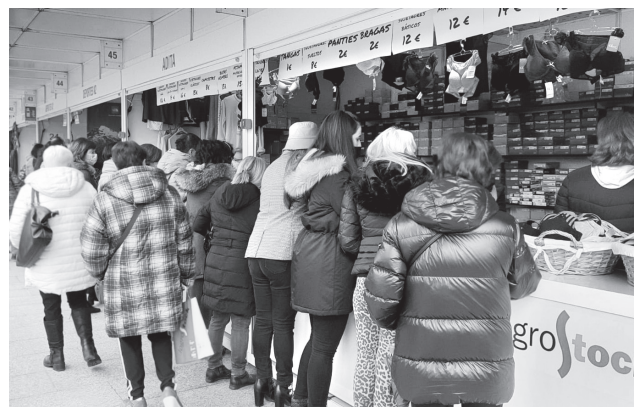
■ El Ayuntamiento apoya y financia Logrostock, uno de los eventos comerciales más multitudinarios.

pales, como el Impuesto sobre Actividades Económicas (IAE), permanecen congeladas.