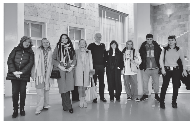
■ El alcalde y la concejala de Juventud, junto a algunas de las jóvenes becadas.