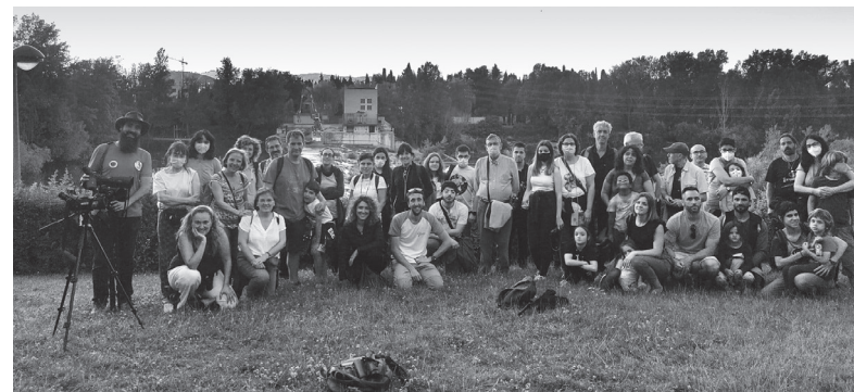
■ Participantes en una de las salidas divulgativas de observación.

Los datos recopilados revelan que la ciudad alberga una gran diversidad de fauna. En Logroño se pueden ver desde especies comunes, como gorriones o ardillas, hasta otras mucho menos abundantes, como el visón europeo, uno de los mamíferos más amenazados de Europa; la náyade mediterránea; o la mariposa arlequín. Además, también existen en el terreno urbano especies de ungulados, topes, murciélagos, lagartos, serpientes, ranas y sapos, tritones, peces, gusanos, caracoles terrestres y acuáticos, arañas, insectos, crustáceos, ciempiés y milpiés, entre otras.