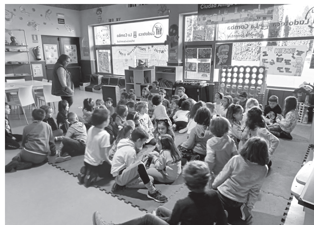
■ Ludoteca La Comba, en Cascajos.

Con el fin de apoyar especialmente a las familias que requieren más el servicio, el Ayuntamiento ha establecido un primer turno de inscripción para familias preferentes, en el que se asegura la participación de familias con víctimas de violencia de género. También se da prioridad a familias monoparentales, familias numerosas y familias de acogida, así como a familias con problemas de conciliación.