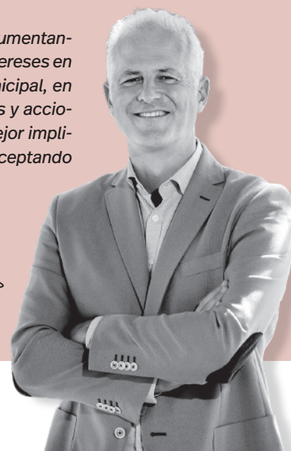
Pablo Hermoso de Mendoza | Alcalde de Logroño

za, evoluciona y se transforma y lo hace argumentando, razonando y dirimiendo los conflictos e intereses en un marco democrático, Pleno tras Pleno municipal, en todas y cada una de nuestras conversaciones y acciones. Conservar la buena vida para convivir mejor implica avanzar y evolucionar. En esto creemos, aceptando que haya gente que piensa diferente.