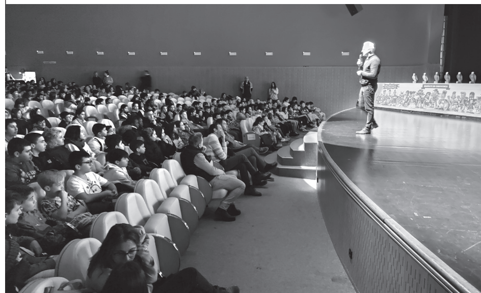
■ Escolares que estuvieron en el acto del Auditorio de Logroño.