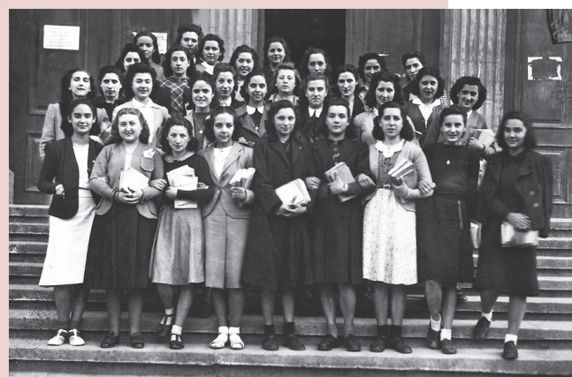
■ Alumnas de quinto en el Instituto, 1941..

finalmente estudios de Magisterio y fue por oposición profesora numeraria de la Sección de Letras en Escuelas Normales de Magisterio, primero en Barcelona y luego en Madrid y, posteriormente, de la Escuela de Estudios Superiores de Magisterio. Se la conoce por su trayectoria como profesora, pedagoga y muy prolífica escritora.