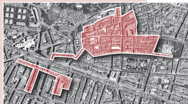
■ Plano de Logroño con las dos zonas de protección acústica especial (ZPAE).

Este estudio avanza en la propuesta de declaración de Zonas de Protección Acústica Especial (ZPAE) y la realización de planes zonales. Además, atendiendo a la Ordenanza municipal que incluye estas acciones,