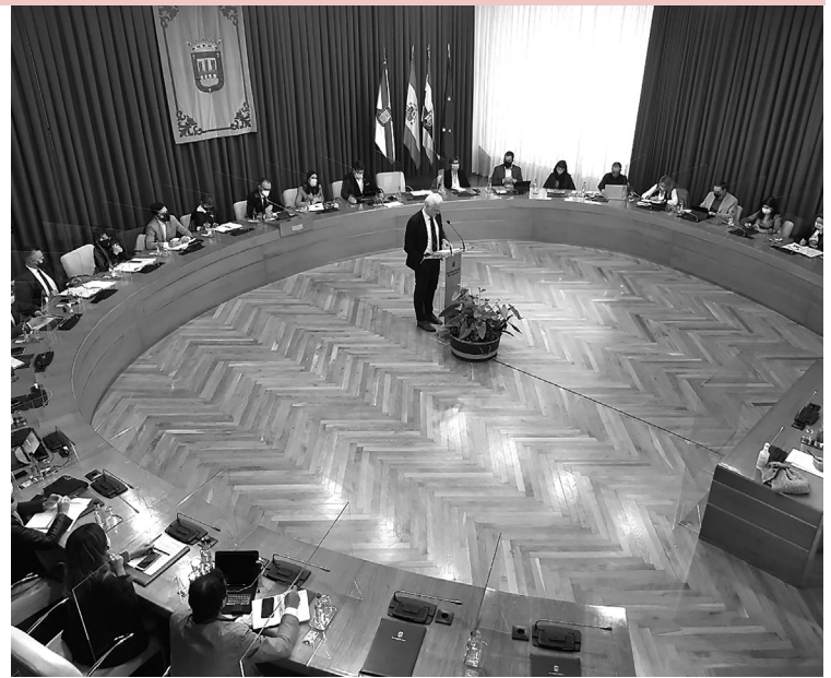
■ El alcalde de Logroño, Pablo Hermoso de Mendoza, interviene en su primer Debate sobre el Estado de la Ciudad.

La pandemia ha protagonizado parte de su discurso. "Logroño ha sabido responder y ha demostrado una vez más su compromiso con los más necesitados", ha dicho, al tiempo que ha recordado que "el Ayuntamiento ha reforzado este año su presupuesto en el área de Servicios Sociales, aumentándolo un 12%".