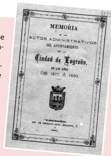
■ Memoria municipal 1877 a 1880

¿De qué rinde cuentas ese cuatrienio el Ayuntamiento logroñés? En primer lugar, de su gestión económica: estado de gastos e ingresos y situación de la deuda municipal. Después, el marqués de San Nicolás, alcalde de la ciudad, va desgranando las acciones realizadas por el Consistorio durante este período en diferentes ámbitos competenciales: la intervención realizada para revitalizar la vida comercial de la ciudad, mediante el ensanche de las calles Abades, Cerrajerías y Carnicerías, conectando así la estación del ferrocarril con la calle del Mercado; las gestiones realizadas para la instalación en la ciudad de un cuartel de Infantería, para el que la ciudad proporciona solar y debe afrontar algún pago; la puesta en funcionamiento del pantano de La Grajera; la creación de una academia de dibujo; la subvención otorgada para el funcionamiento de una escuela de niñas en El Cortijo; la crea-