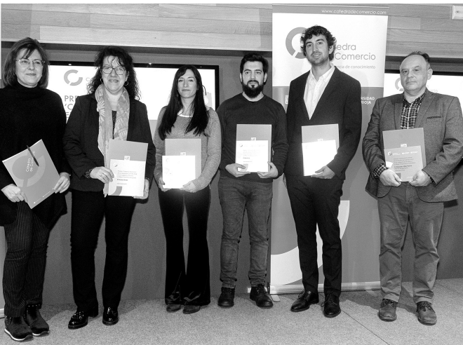
■ Ganadores de los Premios Comercio Excelente 2019.

El Ayuntamiento de Logroño y la Cátedra de Comercio de la Universidad de La Rioja han presentado la convocatoria de los 'Premios Comercio Excelente de la Ciudad de Logroño 2020', que reconocen las buenas prácticas y excelencia del comercio local logroñés en su contribución al desarrollo de la capital riojana.