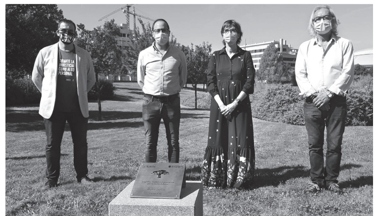
■ Representantes municipales junto al eurodiputado socialista César Luena en el acto 'Un árbol por Europa'.

Con su firma, todos los alcaldes participantes asumieron el compromiso de plantar un árbol en su municipio antes del 5 de junio de 2020, Día Mundial del