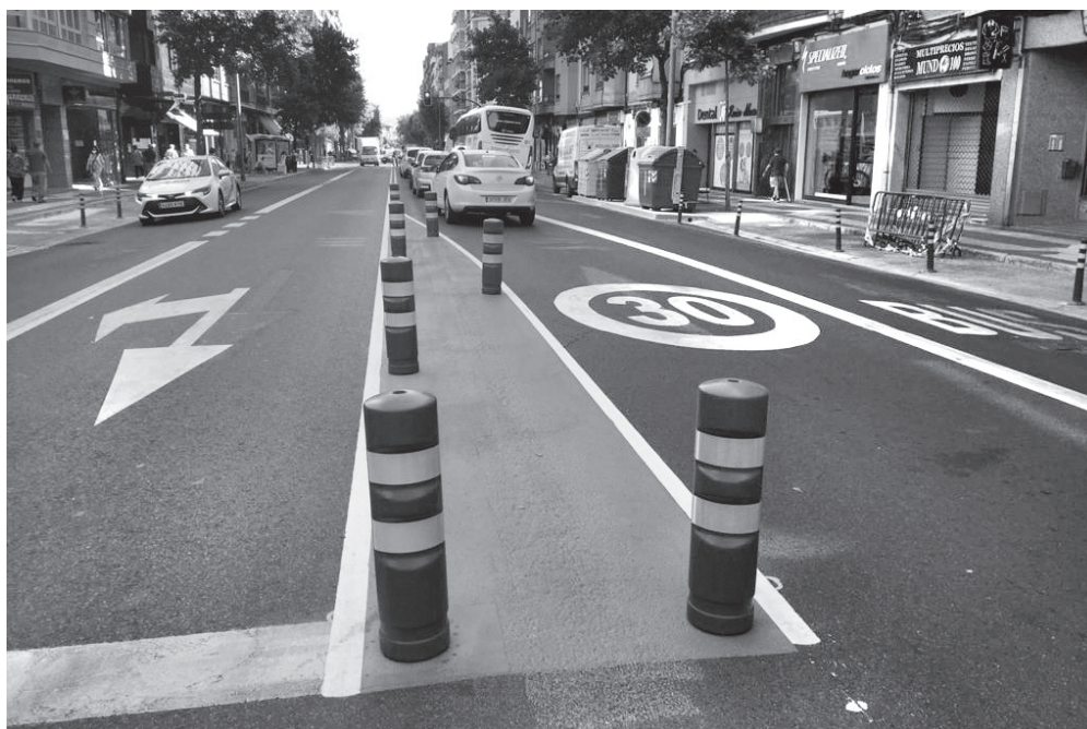
El carril-bus de Vara de Rey es exclusivo para la circulación de autobuses.

De esta forma, la calle Vara de Rey, en el tramo comprendido entre las calles Huesca y Gran Vía, obtiene un total de 1.600 metros cuadrados para el disfrute de la ciudadanía al ampliarse el espacio