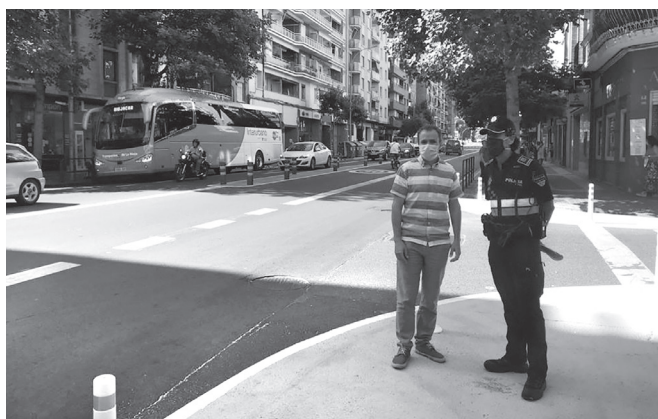
La Policía Local controlará el buen uso del carril-bus.

En el caso de que la línea exterior del carril bus sea discontinua, se puede ocupar ese tramo del carril solo para cambiar de dirección (girar a la derecha) o para hacer uso de los espacios de carga y descarga y de los estacionamientos de personas con discapacidad que existen en Vara de Rey si los vehículos tienen autorizado el uso de esos espacios. Siempre tienen preferencia los vehículos que están ya circulando