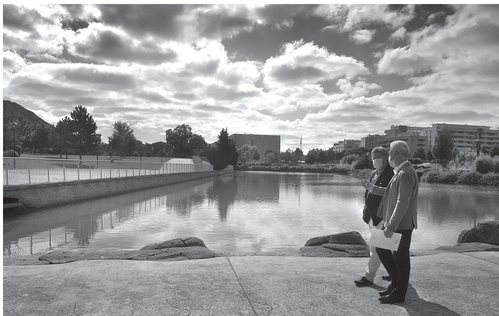
■ El alcalde de Logroño, Pablo Hermoso de Mendoza, junto al diputado Juan López de Uralde.

El alcalde ha afirmado que es un proyecto a medio plazo para toda la ciudad que ha de contar con la participación y la implicación de todas las personas, colectivos y empresas. “El Ayuntamiento de Logroño organizará actividades de participación ciudadana vinculadas con todas las áreas que se valoran en el concurso para lograr que todos sintamos que se trata de un proyecto conjunto. Es importante entender que optar a ser Capital Verde Europea es involucrarse en un proceso de