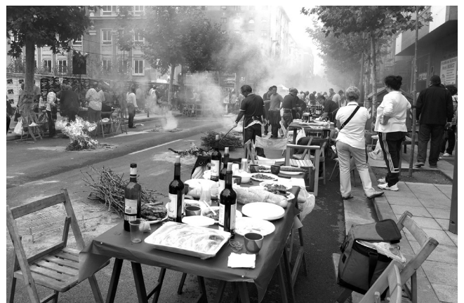
■ Diferentes escenas festivas del pasado Sanmateo.