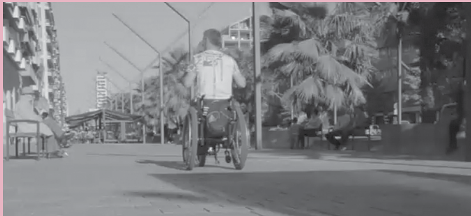
Imagen del vídeo 'Una ciudad para todos' proyectado durante la jornada

Como colofón, antes de las conclusiones y la clausura de las Jornadas Europeas Sobre Accesibilidad en los Municipios, se celebró una mesa redonda sobre ejemplos de buenas prácticas, en el que participarán representantes de los ayuntamientos de Logroño, Santander, Calahorra y Soria.