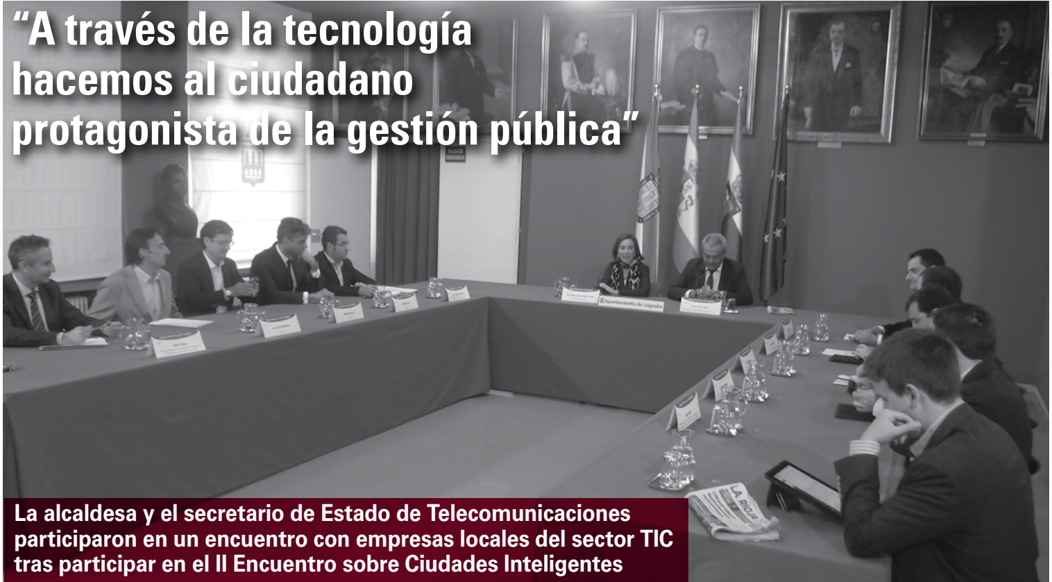
La alcaldesa y el secretario de Estado de Telecomunicaciones participaron en un encuentro con empresas locales del sector TIC tras participar en el II Encuentro sobre Ciudades Inteligentes