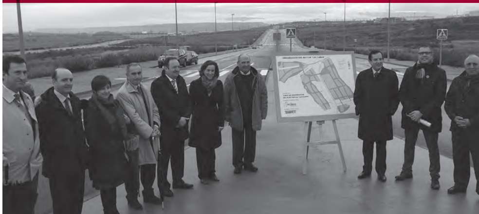
El Ayuntamiento de Logroño recibió las obras de urbanización del polígono de Las Cañas a finales de febrero

El Ayuntamiento acaba de recibir este parque industrial, que cuenta con 1,77 millones de metros cuadrados, 868.000 de ellos industriales