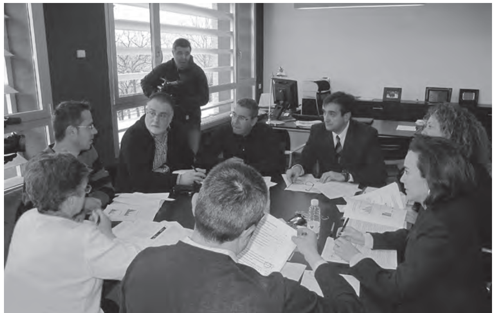
Un momento de la reunión de la comisión de seguimiento del servicio de mediación

De esta forma, de las 267 familias que ya se encuentran con una resolución favorable en sus manos, en 240 casos se ha negociado con las entidades financieras un acuerdo de reestructuración de la deuda hipotecaria, la quita o la dación en pago; 19 familias han sido clasificadas para trasladarse a una vivienda en alquiler del Fondo Social (propiedad de entidades financieras) y otras 8 han sido realojadas