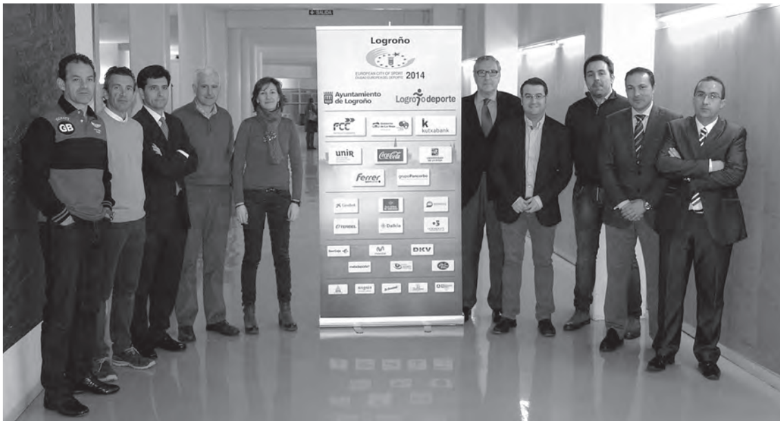
Representantes de las entidades y empresas colaboradoras participaron en la presentación del programa

Más de quince actos deportivos se desarrollarán en marzo, mes que se centra en Deporte y Mujer en el marco de 'Logroño Ciudad Europea del Deporte' .