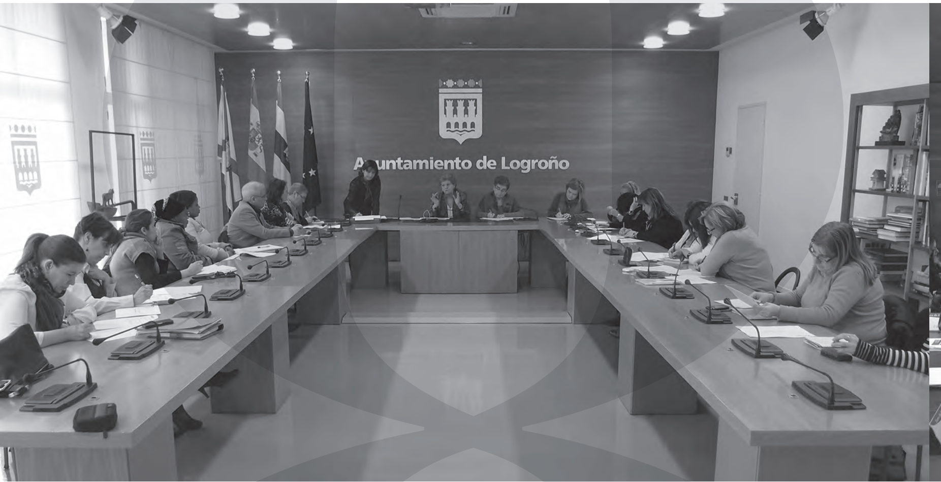
La Mesa de la Mujer es un órgano de participación, de carácter consultivo, que canaliza la participación de las asociaciones y entidades que trabajan en este ámbito y tiene muy en cuenta su opinión a la hora de desarrollar las políticas municipales en este campo.

El 8 de marzo es una fecha para recordar las iniciativas que desarrolla el Ayuntamiento de Logroño a lo largo de todo el año en materia de promoción de la Mujer: en lo que tiene que ver con su desarrollo personal, laboral, de integración y formación; las medidas para profundizar en la igualdad de oportunidades; o lo referente a la lucha contra la violencia de género.