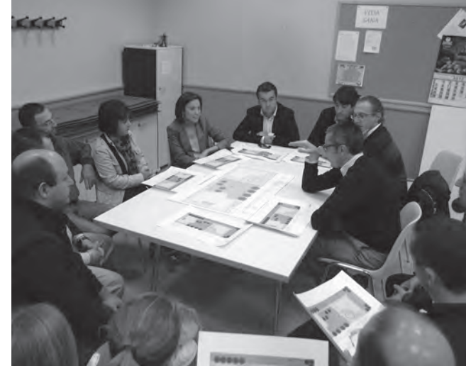
Reunión con los vecinos para explicar el plan de obra

La zona verde que rodea a las piscinas ocupará 865 metros cuadrados. Se plantará césped y arbolado para crear zonas de sombra. En la zona sur de la parcela se instalará un conjunto de juegos infantiles homologados, sobre un pavimento de seguridad, y una fuente bebedera.