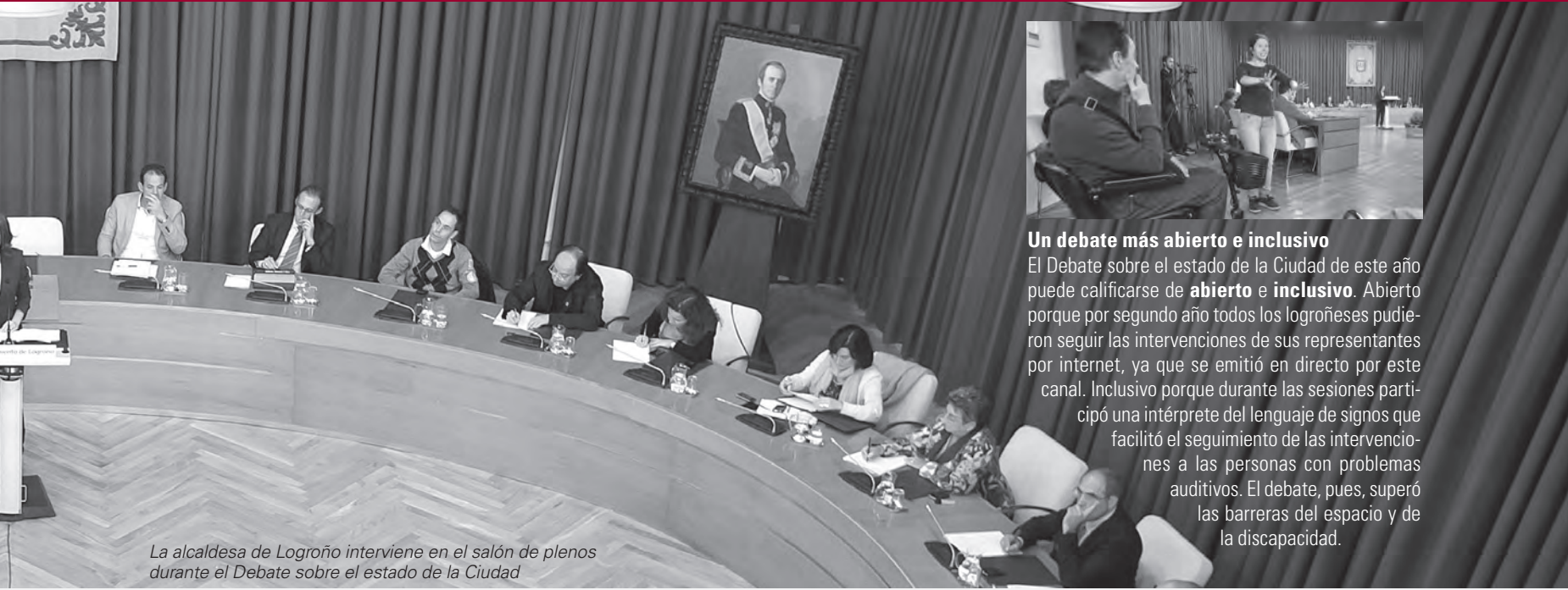
La alcaldesa de Logroño interviene en el salón de plenos durante el Debate sobre el estado de la Ciudad