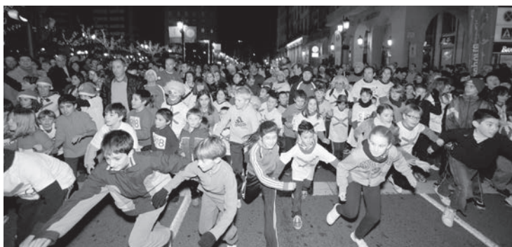
Los niños abrieron los actos del 31 de diciembre con la Mini San Silvestre. La prueba de mayores batió todos sus registros con la participación de más de 4.000 personas.