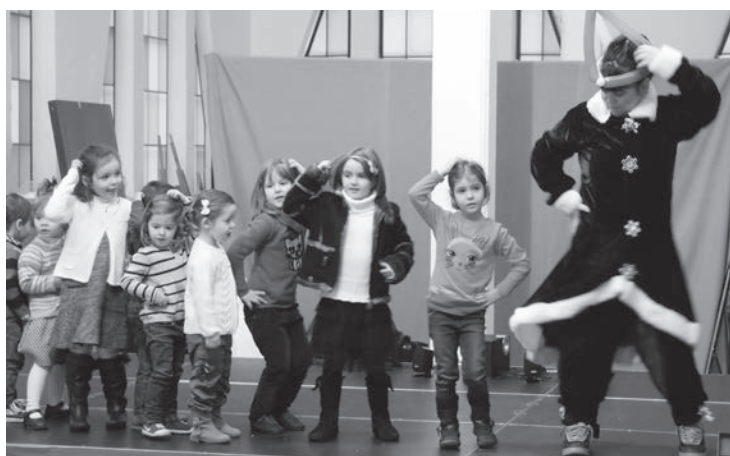
La Plaza de Abastos está acogiendo numerosas actividades durante estos días. En la imagen, un grupo de niñas participa en una de las ludotecas en la planta superior.