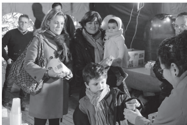
Las actividades de Navidad se iniciaron con una chocolatada solidaria, en la que se entregaba chocolate a cambio de un kilo de comida.