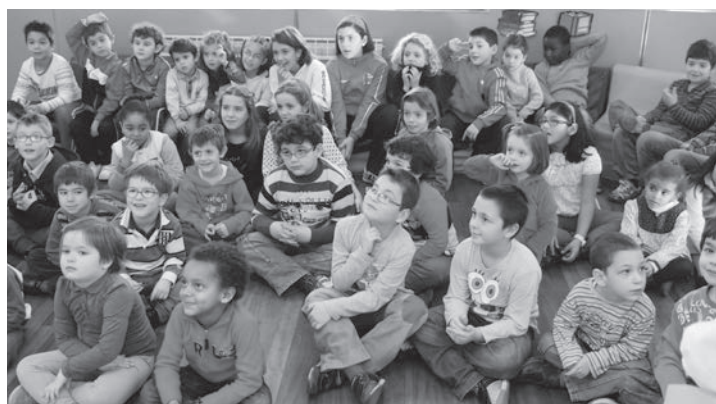
Los niños son los protagonistas de estos días. En la imagen, un grupo de niños atiende las explicaciones en la ludoteca municipal de Lobete.