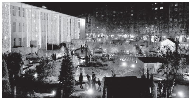
El Belén Monumental instalado en la plaza del Ayuntamiento está siendo uno de los principales atractivos de estas fechas para logroñeses y visitantes.