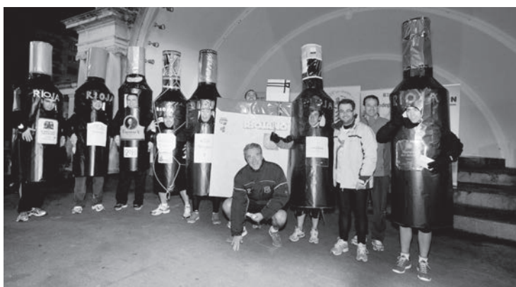
Concejales del Equipo de Gobierno junto a los ganadores del Concurso de Disfraces realizado durante la celebración de la San Silvestre 2012.

Logroño está viviendo intensamente esta Navidad y el Nuevo Año 2013 que acaba de comenzar. Desde la San Silvestre, más popular que nunca al superar su récord con más de cuatro mil participantes hasta las numerosas actividades desarrolladas en la Plaza de Abastos, en las ludotecas y centros jóvenes y en la Gota de Leche, las iniciativas de dinamización comercial, como el Tren de Navidad o las actuaciones callejeras están llenando de vida e ilusión la ciudad. Imágenes decoradas con la iluminación navideña y el Belén monumental o los belenes de la Escuela de Artes, que reciben la admiración de sus numerosos visitantes.