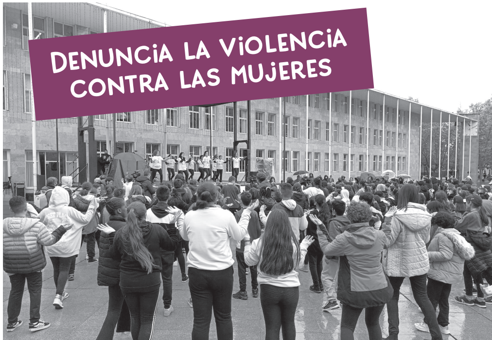
■ Acto de rechazo a la violencia contra las mujeres, con escolares y entidades ciudadanas.

E l Ayuntamiento de Logroño ha organizado, a lo largo de todo el mes de noviembre, un amplio programa de actividades con motivo del Día Internacional de la Eliminación de la violencia contra las mujeres.