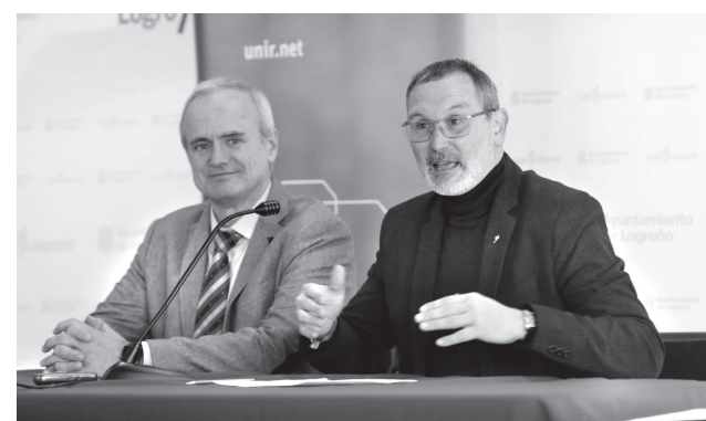
El concejal de Deportes y el decano de la Facultad de Ciencias de la Salud de la UNIR, en la firma.

Por su parte, el decano indicó que "el acuerdo posibilita que nuestros estudiantes hagan prácticas en la tierra que nos ha visto crecer como universidad, en las instalaciones de la capital y de la mano de Lo-