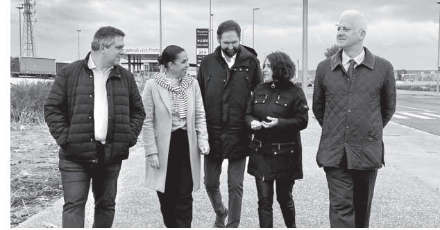
■ El alcalde y la concejala de Promoción Económica, junto a responsables de la FER.

Por otra parte, el Consistorio va a licitar nueve parcelas municipales en la zona oeste del polígono de Las Cañas. En total, se trata de cerca de 69 000 metros cuadrados de superficie para que puedan implantarse indus-