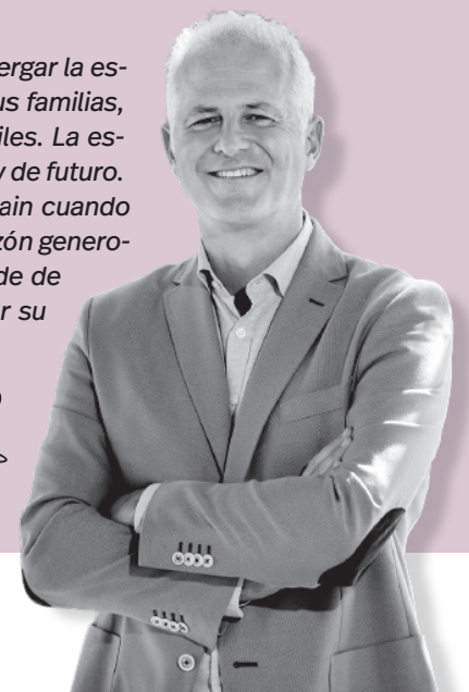
Pablo Hermoso de Mendoza / Alcalde de Logroño

vocaciones, les permiten a sus alumnos albergar la esperanza de un mundo mejor, más allá de sus familias, de sus entornos, a veces, estrechos y difíciles. La escuela, ese espacio mágico de socialización y de futuro. Se lo agradeció Camus a su maestro Germain cuando recibió el Nobel: una mano tendida, un corazón generoso, le dijo. Se lo digo a ustedes como alcalde de Logroño. Gracias por su trabajo diario y por su entrega generosa.