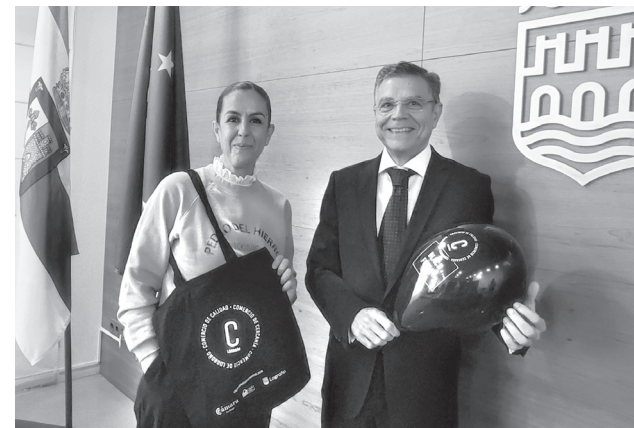
■ La concejala de Comercio y el director de la Cámara, en la presentación de la campaña.

En la campaña cobran especial interés los 5 500 bonos comercio de 10 euros cada uno emitidos los pasados 2 y 18 de noviembre; y los descuentos especiales ofrecidos por los 325 comercios de diferentes sectores adheridos, todos ellos identificados en sus escaparates con la imagen y unos globos de la campaña. El listado de los establecimientos participantes puede consultarse en la web de la Cámara de Comercio. También se repartirán 3 000 bolsas de compra en las zonas comerciales y los mercados de Logroño entre los consumidores que presenten un resguardo de compra igual o superior a 10 euros en los establecimientos adheridos (hasta fin de existencias).