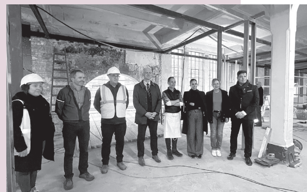
■ El alcalde de Logroño y la concejala de Promoción Económica en una reciente visita a las obras.

Hasta el momento, en la primera planta se ha retirado el mobiliario, enseres y rotulación y se ha derribado la compartimentación conocida de los puestos, lo que ha dejado a la vista unas cristaleras que se mantendrán y aportarán luz y una imagen nueva al mercado. Asimismo, se está restaurando la carpintería exterior con el fin